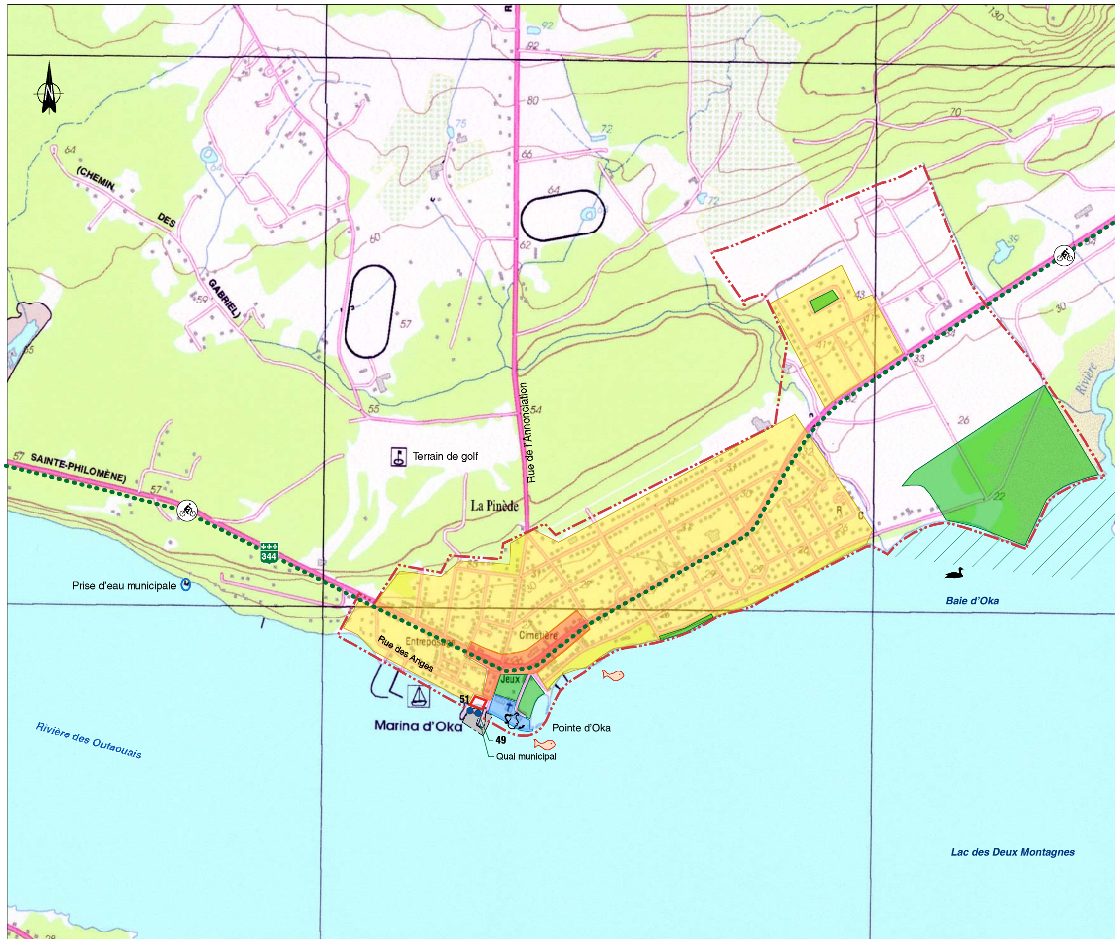
FIGURE 5 INVENTAIRE DU MILIEU SECTEUR OKA