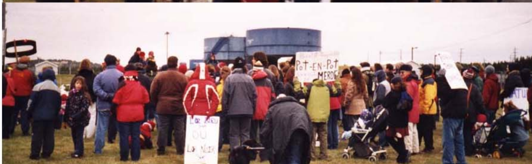
Manifestation à Cap-aux-Meules et devant Hydro-Québec, le 22 novembre 2003