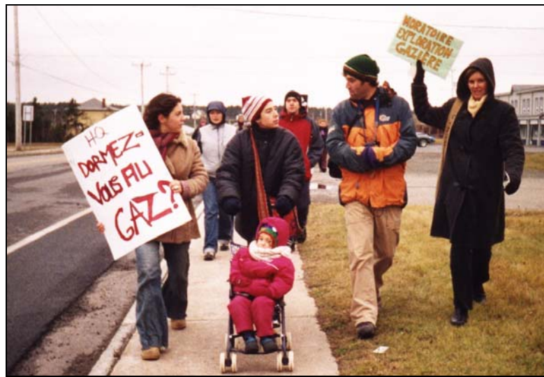
Manifestation organisée par un groupe initial de citoyens, à Cap-aux-Meules et devant Hydro-Québec, le 22 novembre 2003