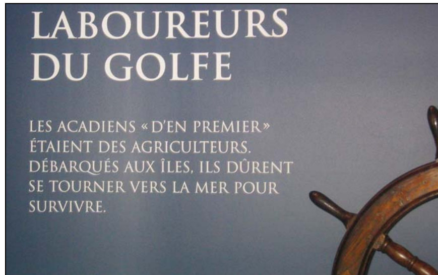
Photo prise au Musée de la Mer

La Table des partenaires pour l'emploi des Îles de la Madeleine est une concertation d'organismes socioéconomiques de l'archipel madeleinois qui s'est formée à partir d'un événement marquant qui a eu lieu en pleine crise économique, en 1999 : le Forum sur l'emploi. La situation difficile qui prévalait depuis le début de la décennie 90 était principalement tributaire du moratoire sur la pêche aux poissons de fond. Plusieurs centaines de Madeleiniennes et de Madelinots se retrouvaient alors en recherche d'emploi et un Plan de relance tentait de remettre l'économie sur ses rails. Comment remobiliser un peuple insulaire, traditionnellement tourné vers la mer et ses ressources, quand le gagne-pain traditionnel n'est plus accessible ?