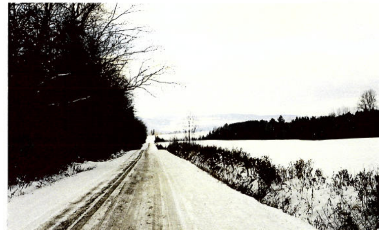
Vue 15 g) – Chemin Mitchell Vue encadrée par la végétation faisant découvrir les collines Haskell qui referment l'arrière-plan