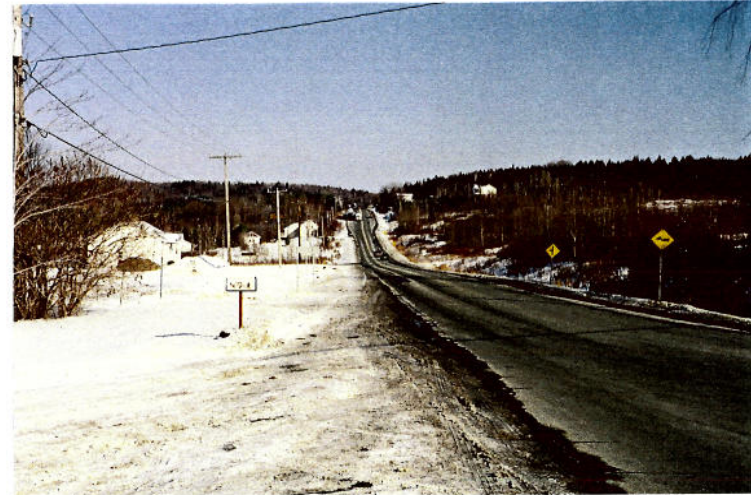
Vue 4 d) – Chemin Dunant ▶ À l'approche de la montée d'Ascot, vue vers le Mont Bellevue. Les champs d'accès visuels sont limités par la végétation et la topographie ascendante à l'est (à droite)