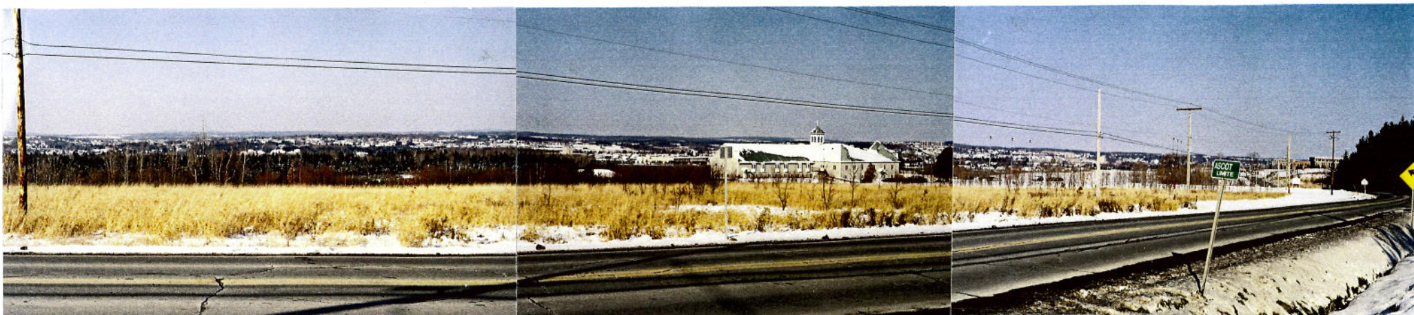
Vue 4 a) partie droite (côté nord) – Chemin Sainte-Catherine Panorama couvrant la vallée de la rivière Magog. En avant-plan, le bâtiment des Missionnaires de Marian Hill. À l'extrême droite, quelques bâtiments du campus de l'Université de Sherbrooke