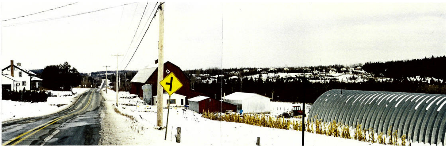
Vue 14 a) – Intersection des chemins Belvédère et Smith Panorama vers la vallée de la rivière Massawipi. Caractère champêtre avec dominance des collines Haskell où se détachent les résidences de Belvedere Heights. La vue couvre toute la portion est du territoire à l'étude (unités de paysage no 12 à 20)