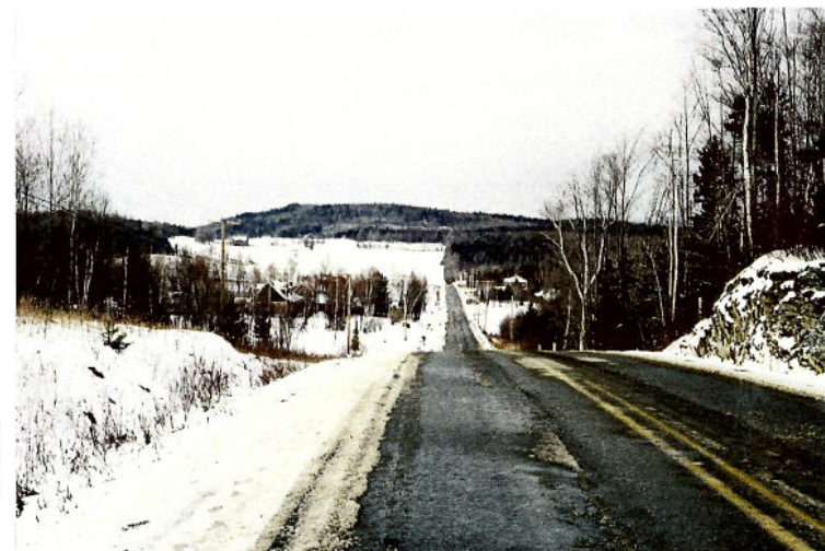
Vue 7 a) – Chemin d'Albert ▶ Percée visuelle vers le Mont Bellevue. La linéarité et le rapprochement du boisé axent la vue vers le point de repère du Mont Bellevue. Présence d'une antenne comme élément discordant du paysage, localisée sur le Mont Bellevue