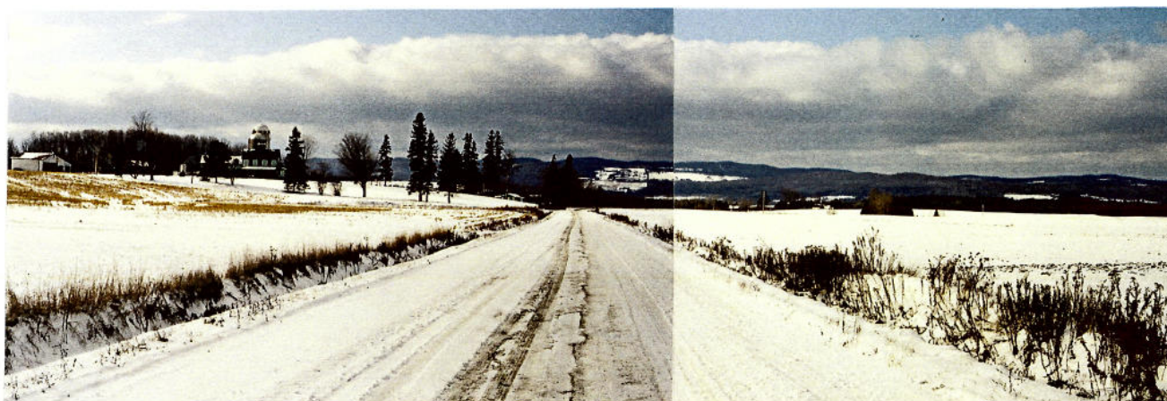
Vue 19 h) – Chemin Mitchell Panorama à caractère champêtre avec accents verticaux créés par les silos. Arrière-plan formé par les collines Haskell.