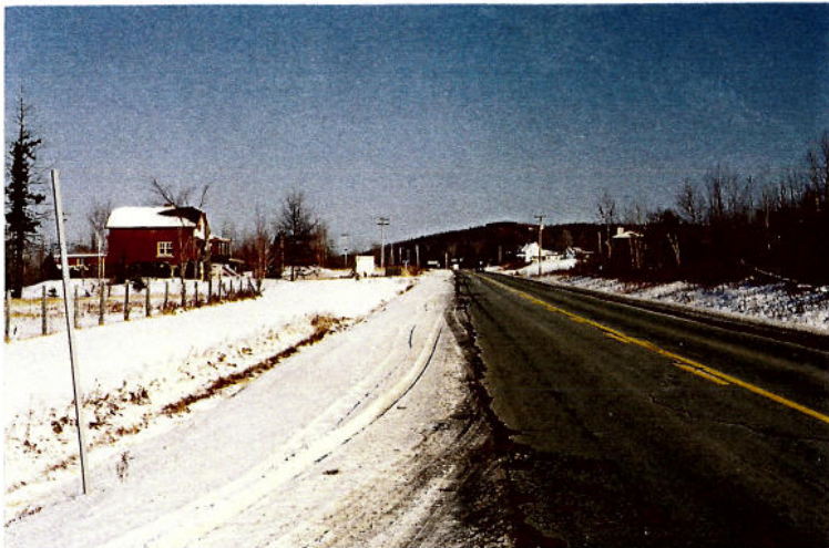
◀ Vue 4 b) – Chemin Sainte-Catherine Vue dirigée vers le Mont Bellevue. Les champs d'accès visuels sont limités par la végétation et la topographie ascendante à l'est (à droite)