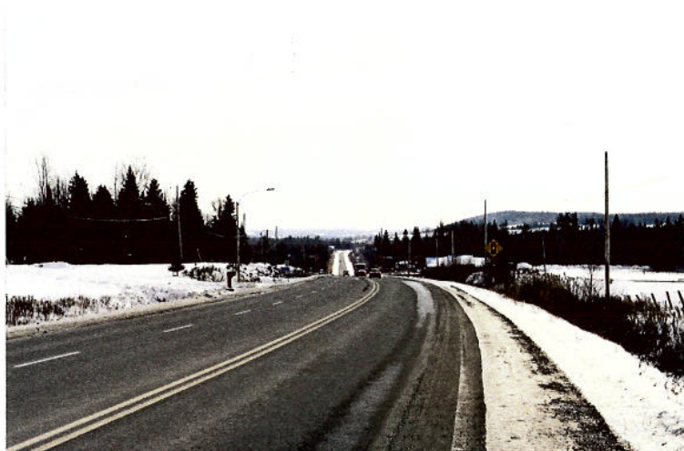
◀ Vue 7 d) – Chemin Belvédère À la descente du plateau, panorama continu vers le sud-ouest. À droite, l'arrière-plan est refermé par les collines localisées entre les chemins Dunant et d'Albert