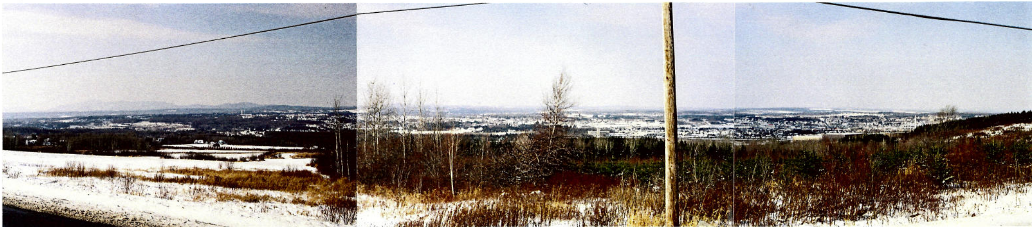
Vue 4 c) – Chemin Bel Horizon À la descente de la terrasse, dégagement panoramique de grande envergure. À l'ouest (à gauche), le Mont Orford et à l'est (à droite) le territoire plus urbanisé de la ville de Sherbrooke