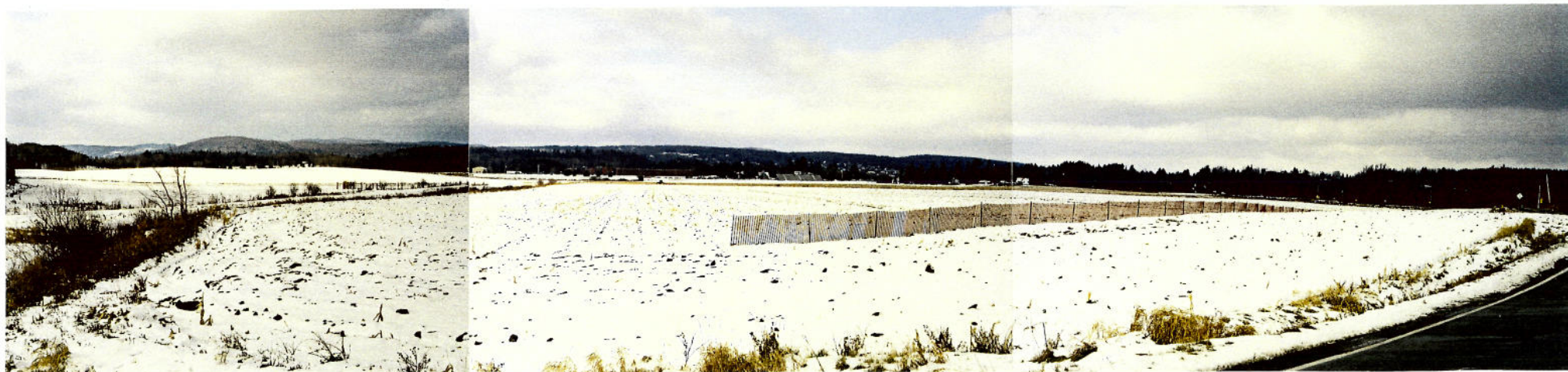
Vue 11 d) – Chemin Glenday À la descente du plateau, large perspective à dominance agricole vers le centre de recherche agricole de Lennoxville caractéristique avec ses silos