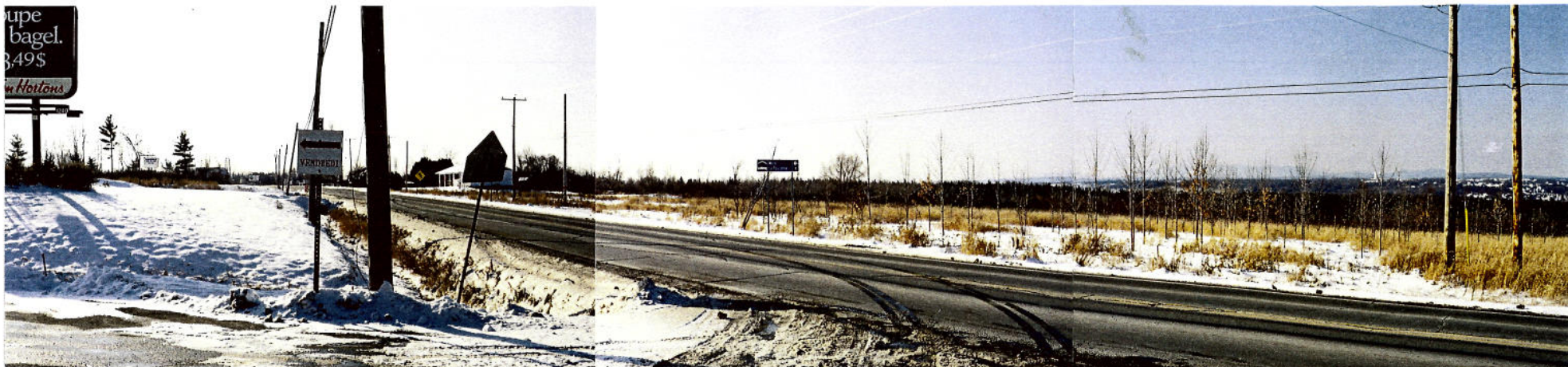
Vue 4 a) partie gauche (côté sud) – Chemin Sainte-Catherine Panorama couvrant la vallée de la rivière Magog. À l'horizon, le Mont Orford, point de repère régional