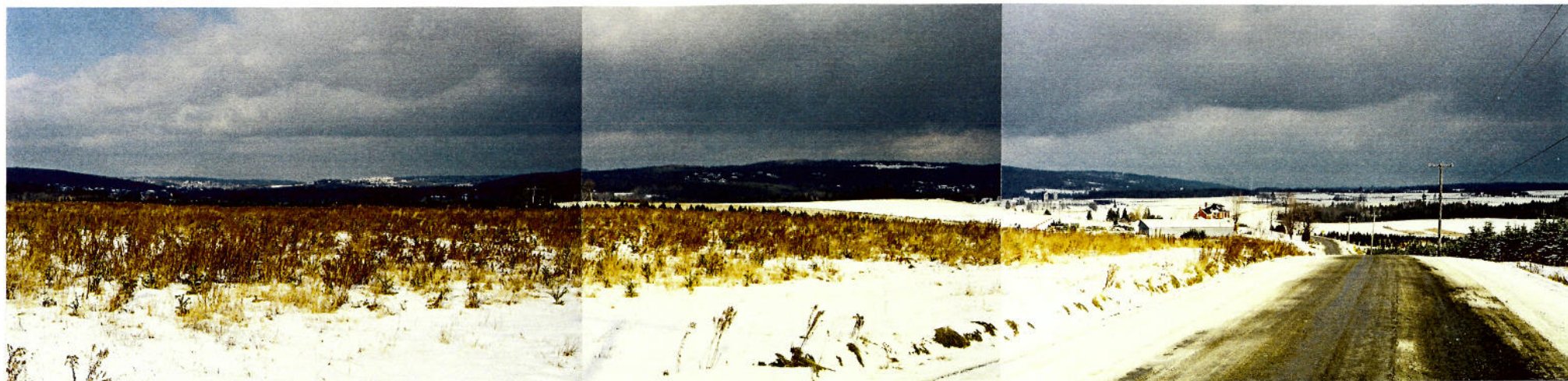
Vue 11 e) – Chemin Glenday Percée visuelle ouverte sur un paysage agricole refermé par les collines à l'arrière de Lennoxville. Seul le gymnase du campus de l'Université Bishop est visible