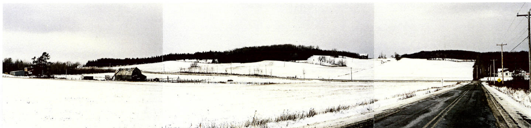
Vue 7 b) – Chemin d'Albert Percée visuelle vers le Mont Bellevue. Linéarité de la route, des boisés et du découpage des terres qui oriente les vues vers le point de repère