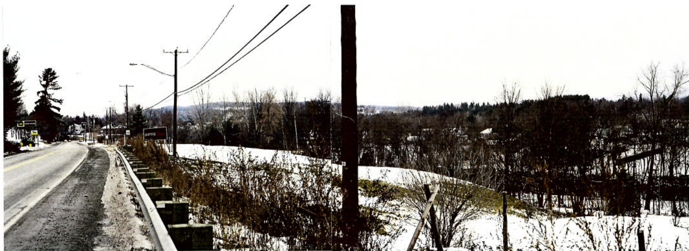
Vue 9 f) – Route 143, boulevard Hyatt Vue filtrée vers la dépression causée par la rivière Massawipi et vers le chemin Winder dont quelques édifices apparaissent ponctuellement