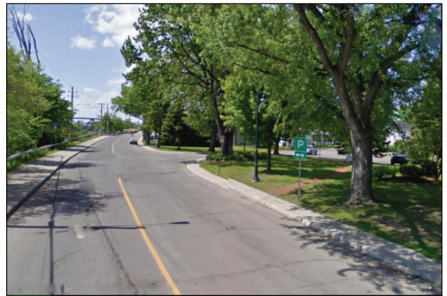
4. Unité : 1.BU.P.FI