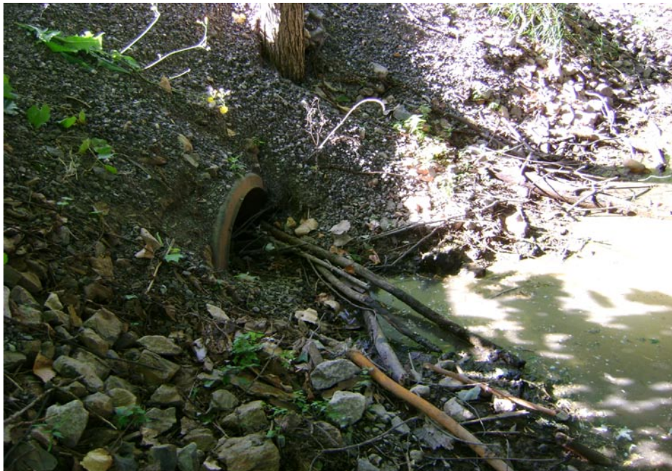
Photographie 18 Vue sur le ponceau, côté milieu humide Cliché pris le 27 août 2009