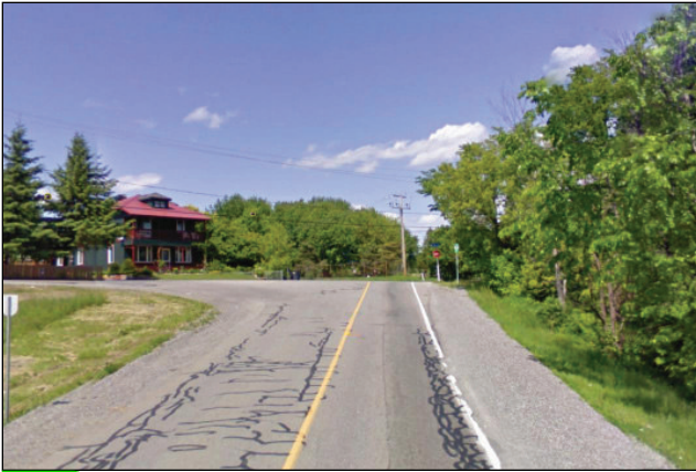
19. Unité : 8.MA.O.FE (à droite)