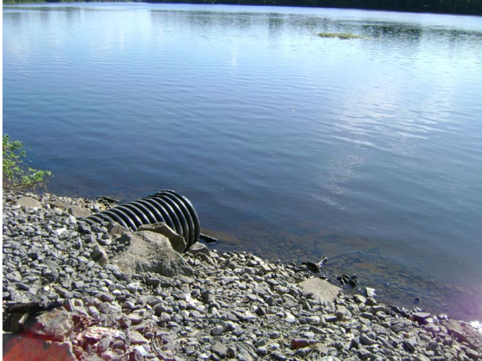
Photographie 19 Vue sur le ponceau, côté rivière des Outaouais Cliché pris le 27 aout 2009