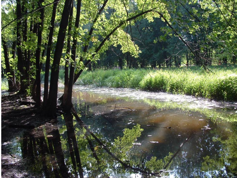
Photographie 3 Cliché pris le 3 aout 2008