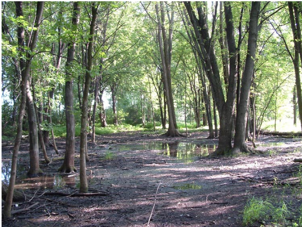
Photographie 6 Cliché pris le 3 aout 2008