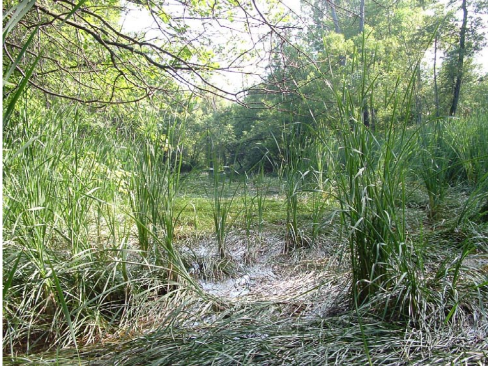
Photographie 1 Cliché pris le 3 aout 2008