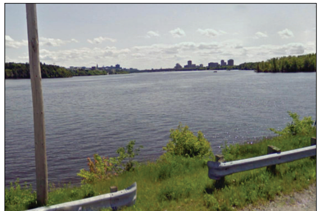
6. Unité : 2.BU.P.OU