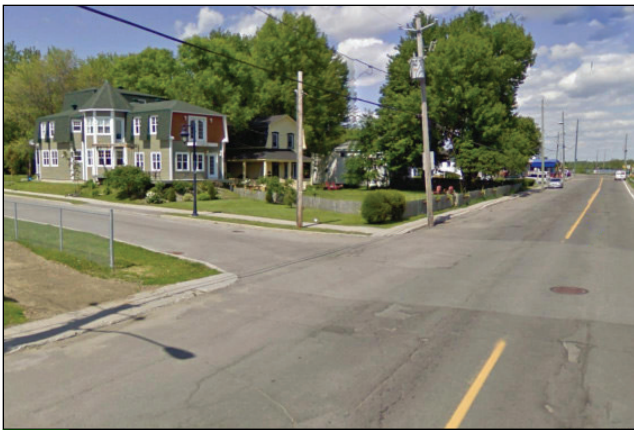
9. Unité : 2.BU.P.OU