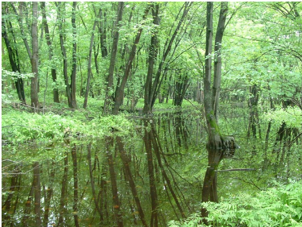
Photographie 2 Cliché pris le 3 aout 2008