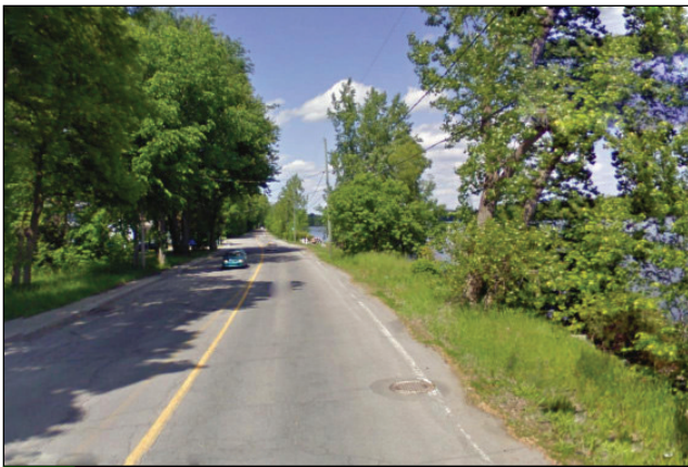
15. Unité : 6.FO.P.FE