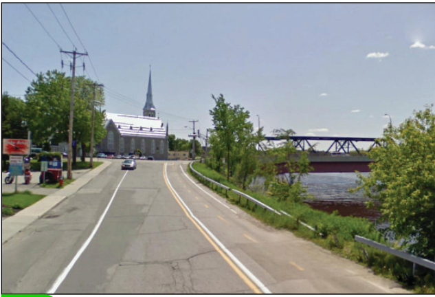
1. Unité : 1.BU.P.FI