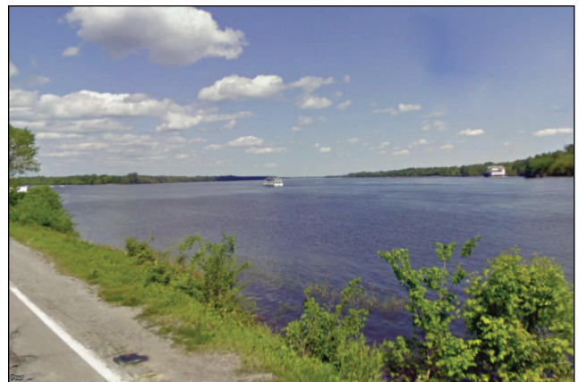
12. Unité : 4.BV.P.OU