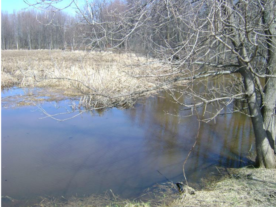
Photographie 13 Cliché pris le 14 avril 2009