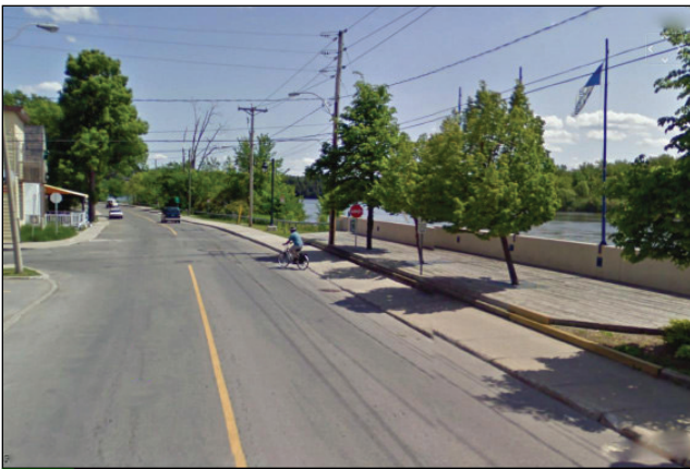
3. Unité : 1.BU.P.FI