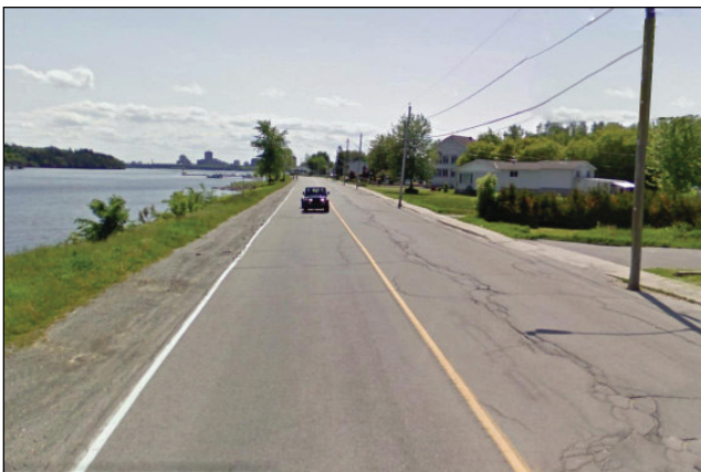
11. Unité : 4.BV.P.OU