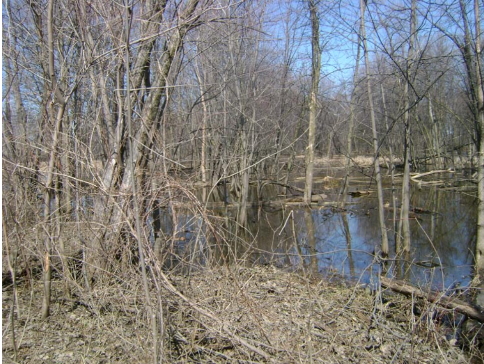
Photographie 15 Cliché pris le 14 avril 2009