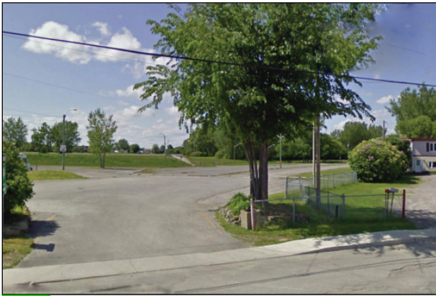
13. Unité : 13.FO.P.FE (arrière-plan) 9.PA.R.OU (avant-plan)