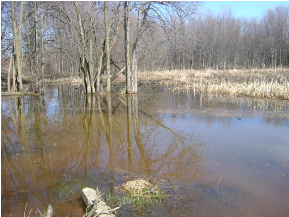
Photographie 16 Cliché pris le 14 avril 2009