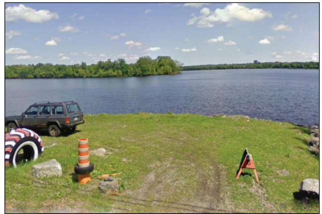
16. Unité : 7.BV.P.OU