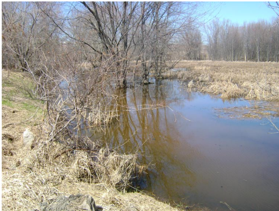
Photographie 12 Cliché pris le 14 avril 2009