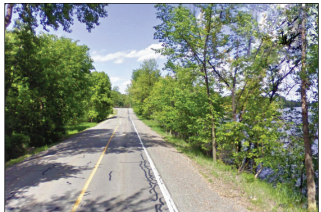
18. Unité : 8.MA.O.FE