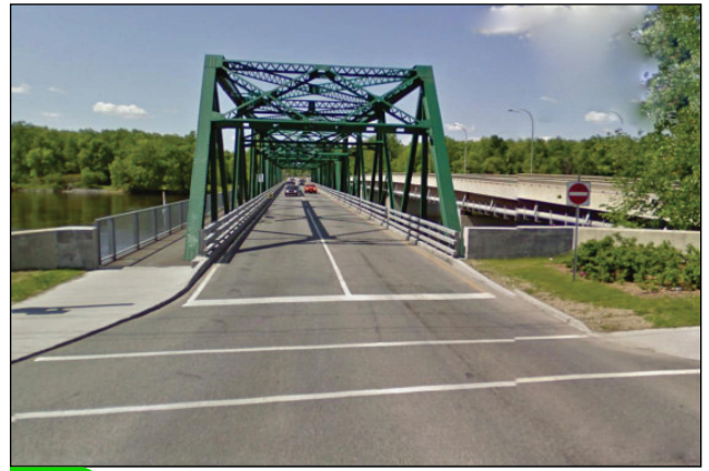
2. Unité : 1.BU.P.FI