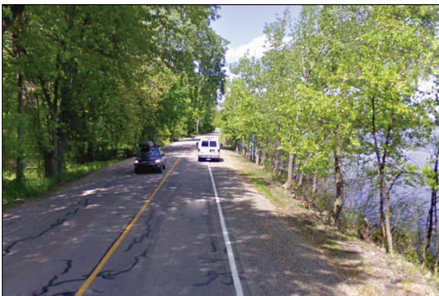
17. Unité : 8.MA.O.FE