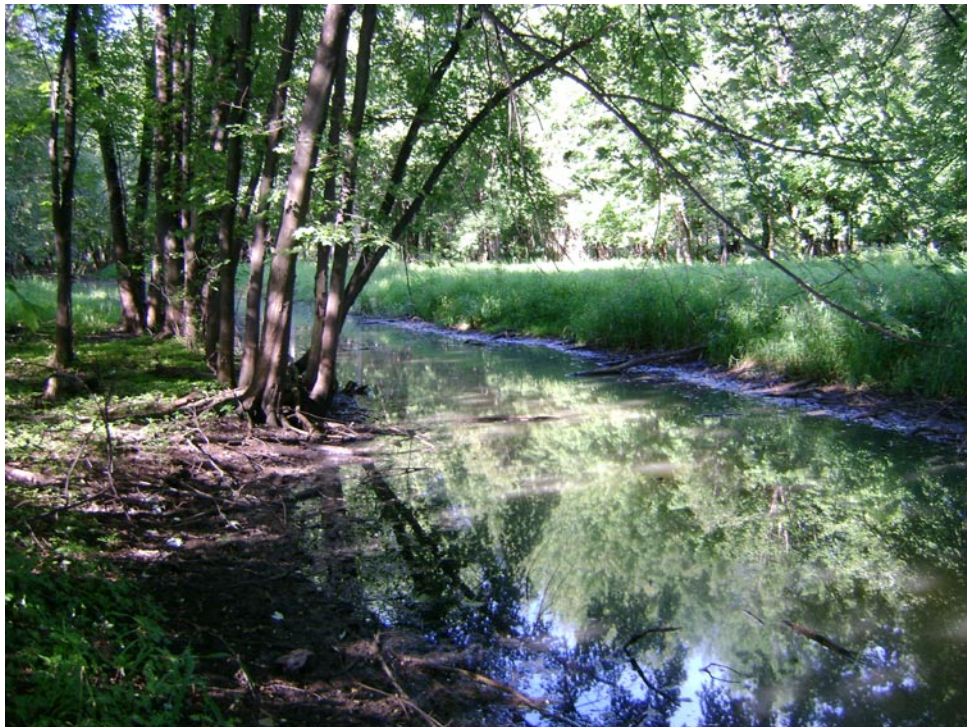
Photographie 10 Cliché pris le 27 aout 2009