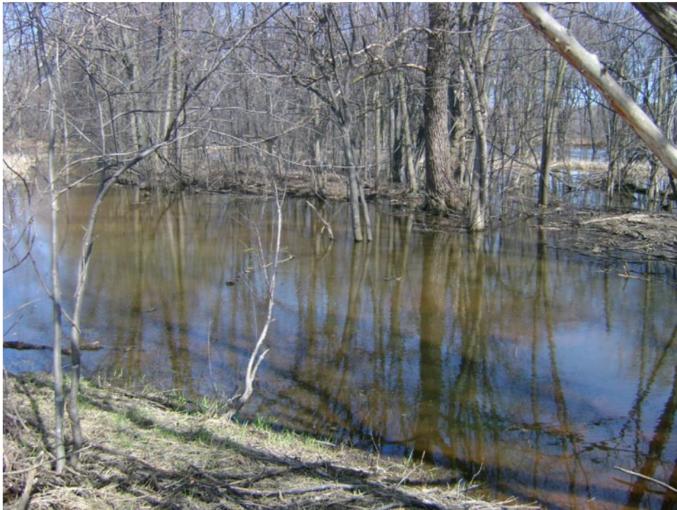
Photographie 14 Cliché pris le 14 avril 2009