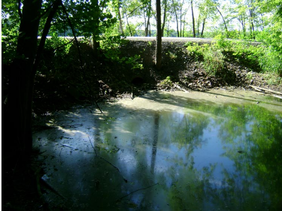
Photographie 7 Cliché pris le 27 aout 2009