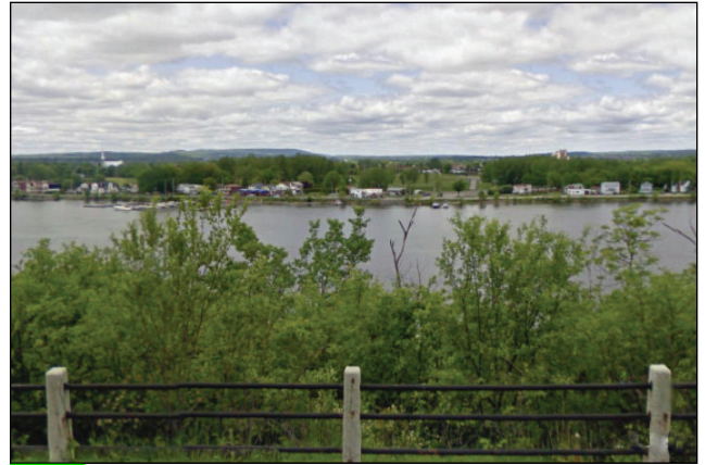
20. Unité : 11.BV.0.FE