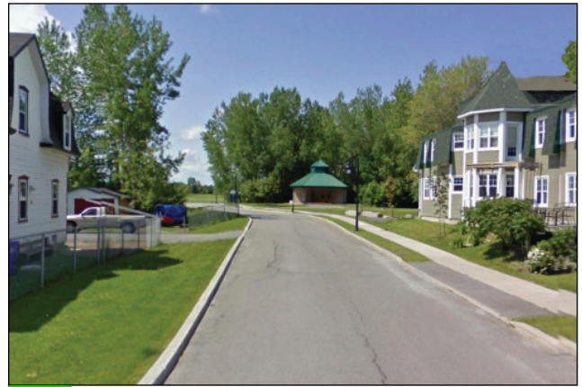
8. Unité : 13.FO.P.FE (arrière-plan)