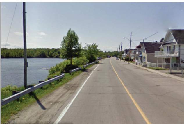
5. Unité : 2.BU.P.OU