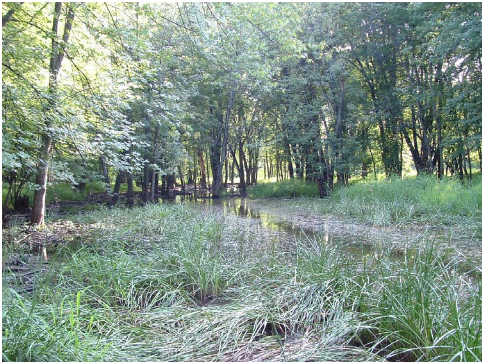
Photographie 4 Cliché pris le 3 aout 2008