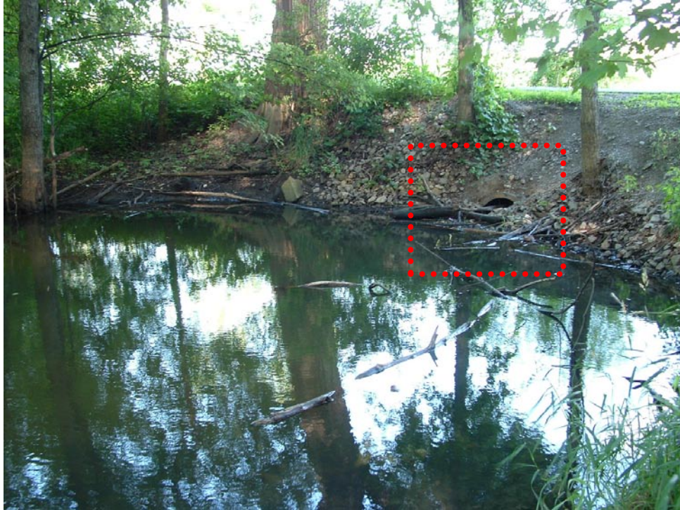
Photographie 17 Vue sur le ponceau, côté milieu humide Cliché pris le 3 août 2008