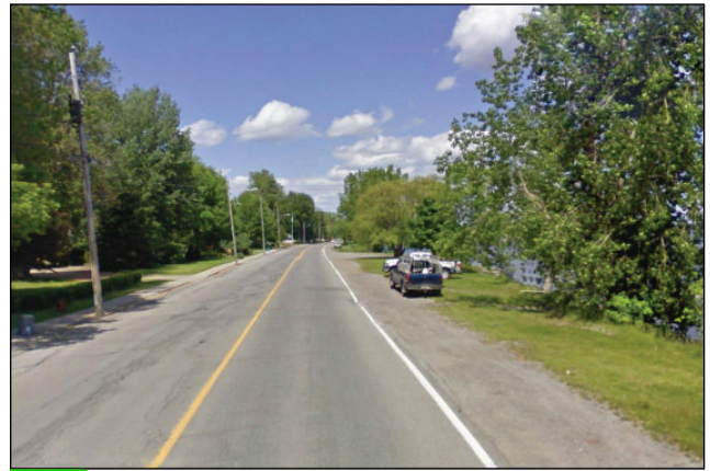
14. Unité : 5.BV.P.FI