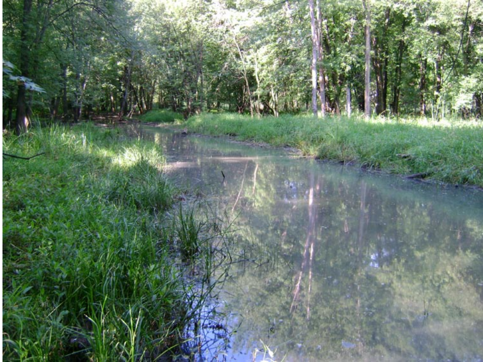
Photographie 9 Cliché pris le 27 aout 2009