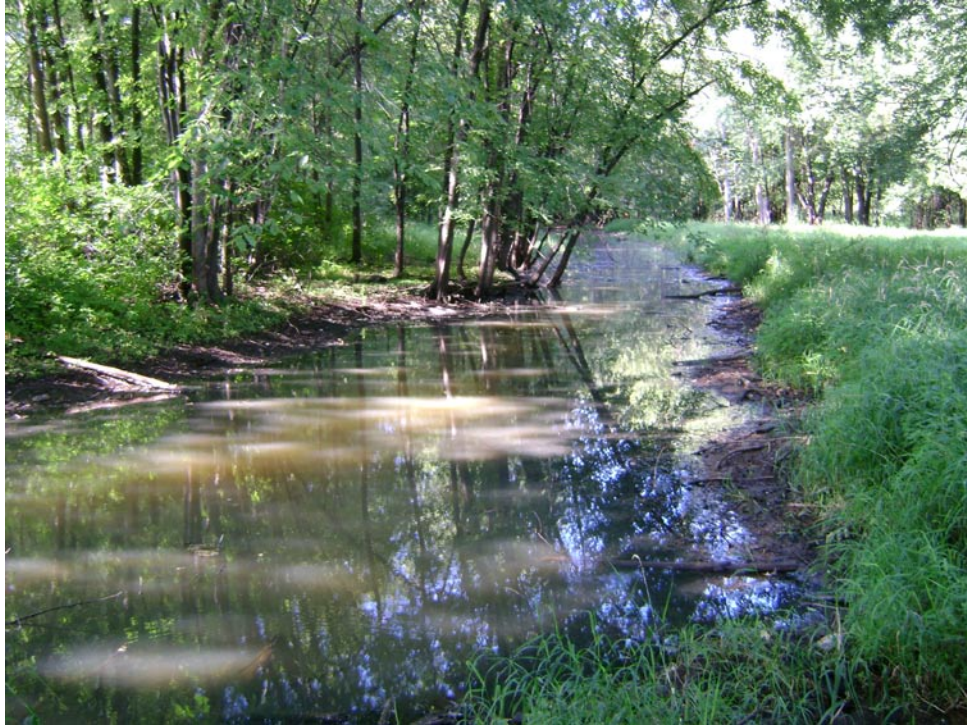
Photographie 11 Cliché pris le 27 août 2009