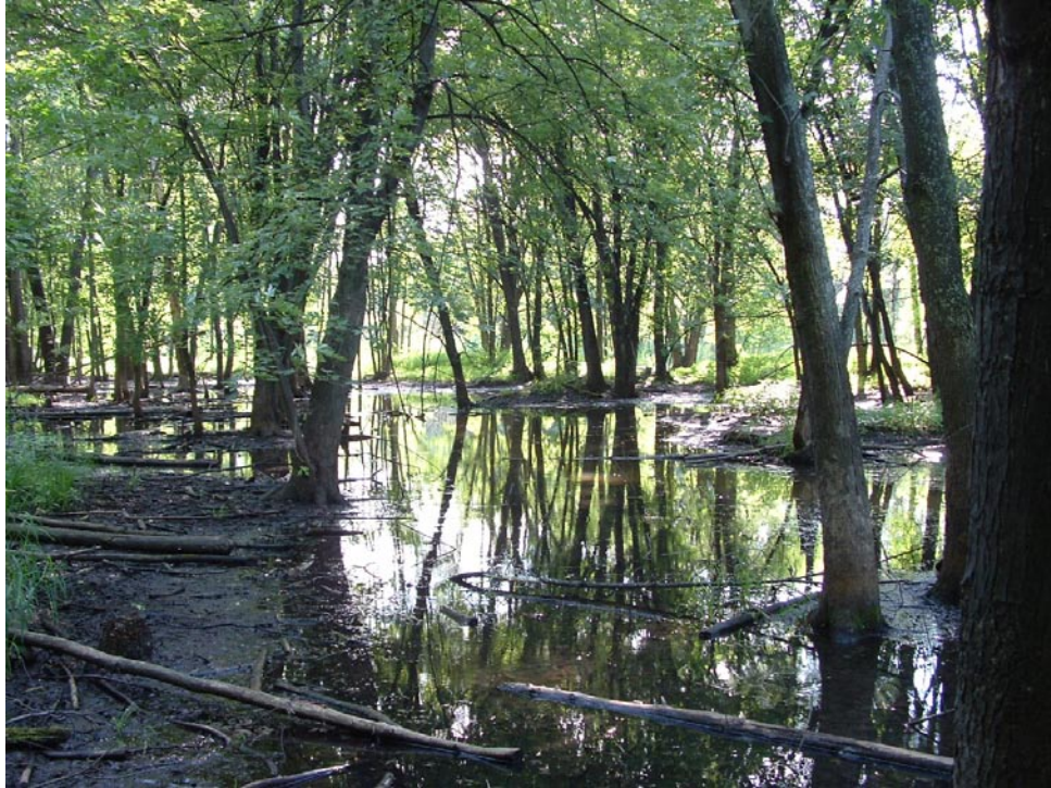
Photographie 5 Cliché pris le 3 aout 2008