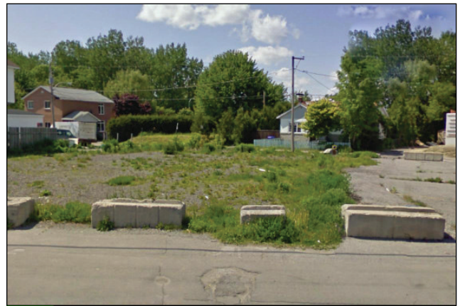
10. Unité : 3.BU.P.FE