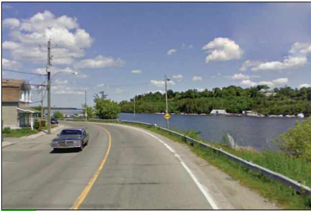
7. Unité : 2.BU.P.OU