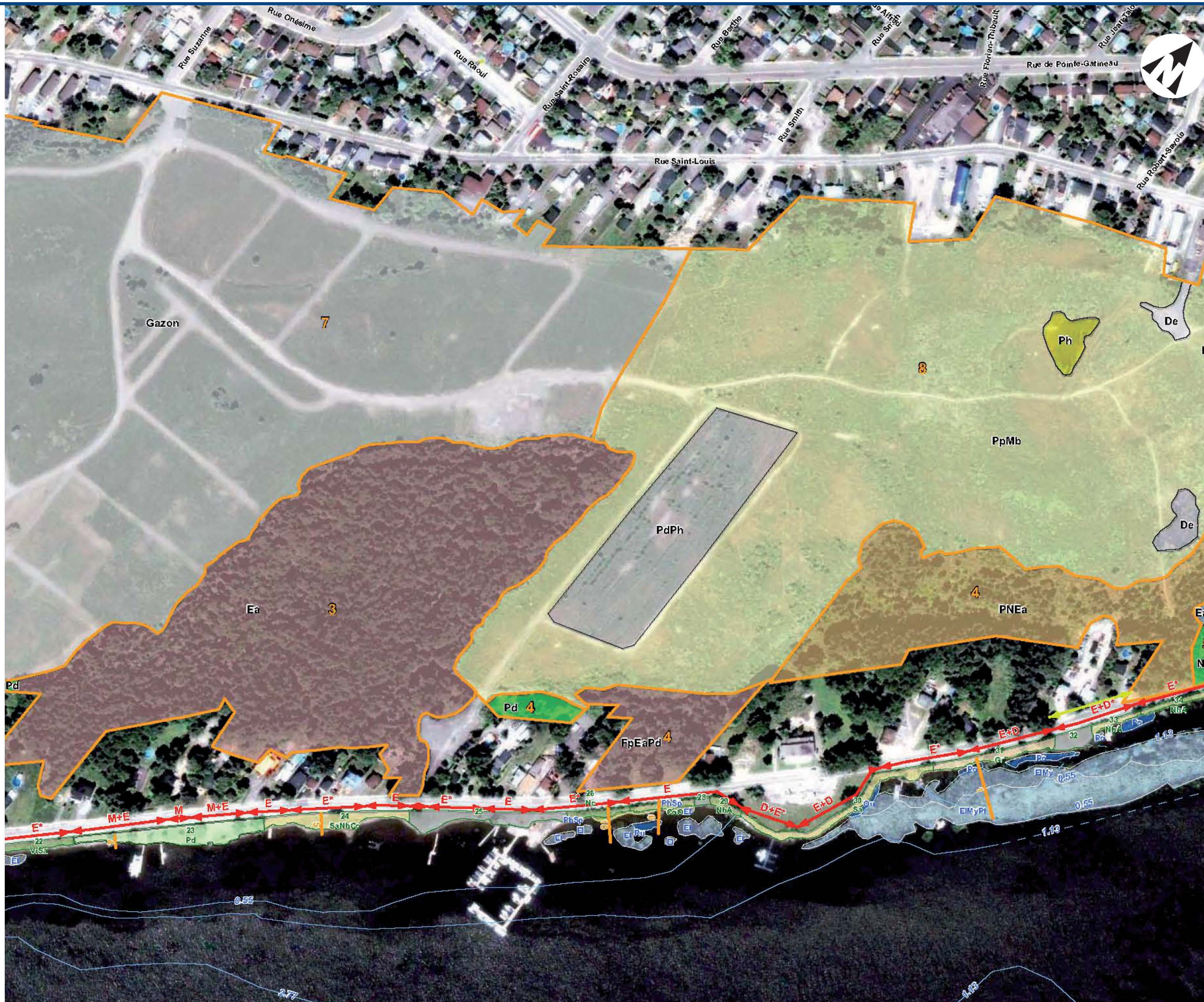
Localisation des feuillets