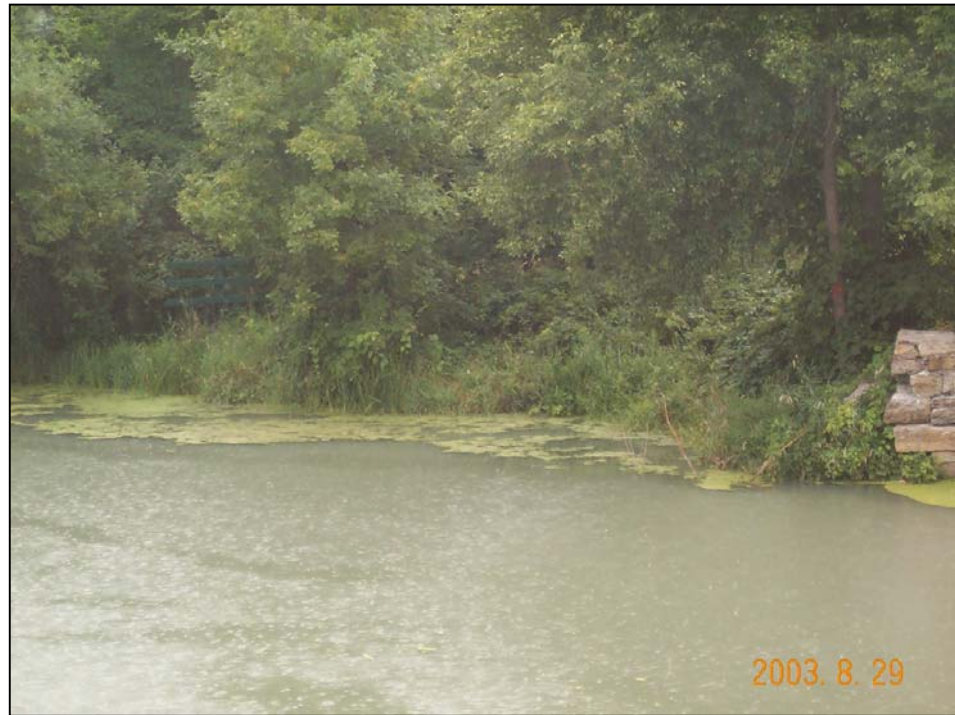
Photo n° 15. Milieu humide sur la rive gauche de la rivière, près de la digue Howard-Smith