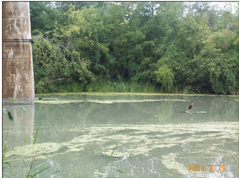
Photo n° 16. Vue sur l'herbier aquatique, composé de Hydrocharis morsus-ranae et de Carex sp. situé sur la rive gauche de la rivière, sous le pont du CN