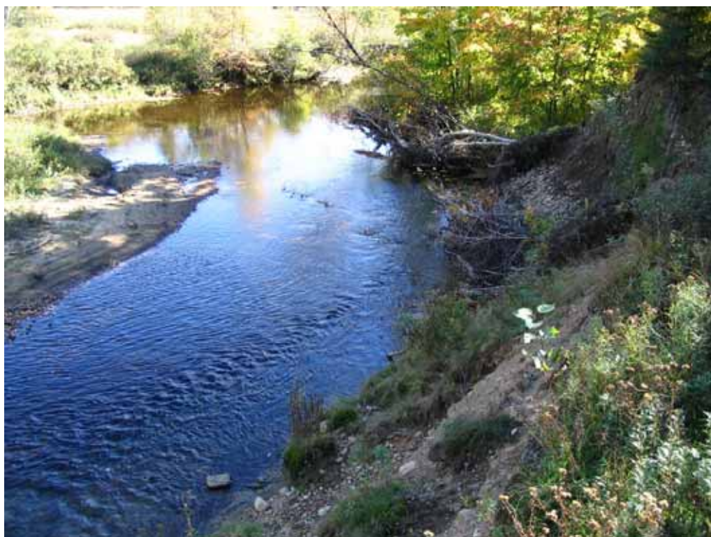
Septembre 2004 : Vue vers l'aval