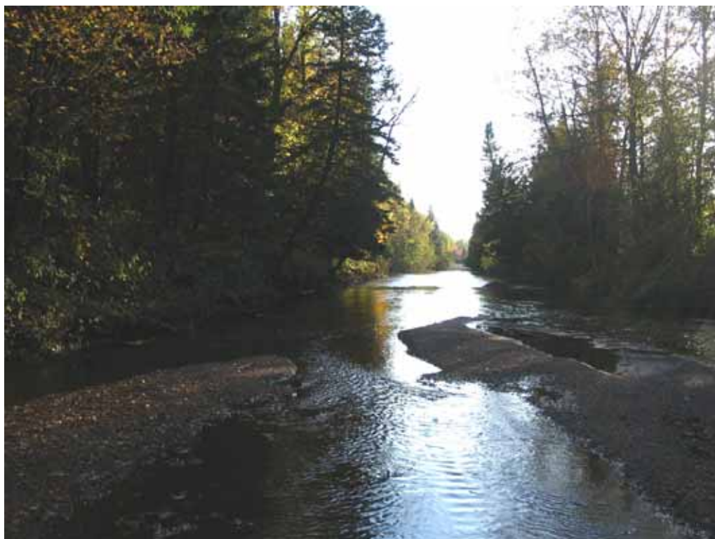
Septembre 2004 : Accumulation de sable et sédiment fin au centre du cours d'eau