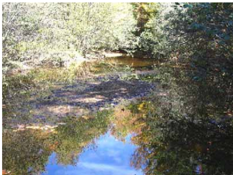
Septembre 2004 : Dépôt de sédiment en amont du barrage