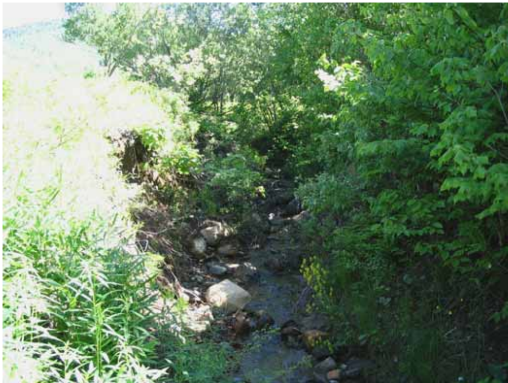
Juillet 2004 : Ruisseau canalisé dont les rives s’érodent et apporte des sédiments à la rivière.