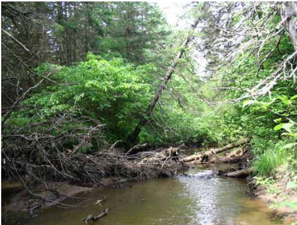
Site #11 – Zone d’embâcle d’accumulation importante de débris sur la rivière Hibou