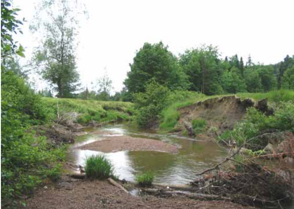
Juillet 2004 : Érosion et alluvionnement