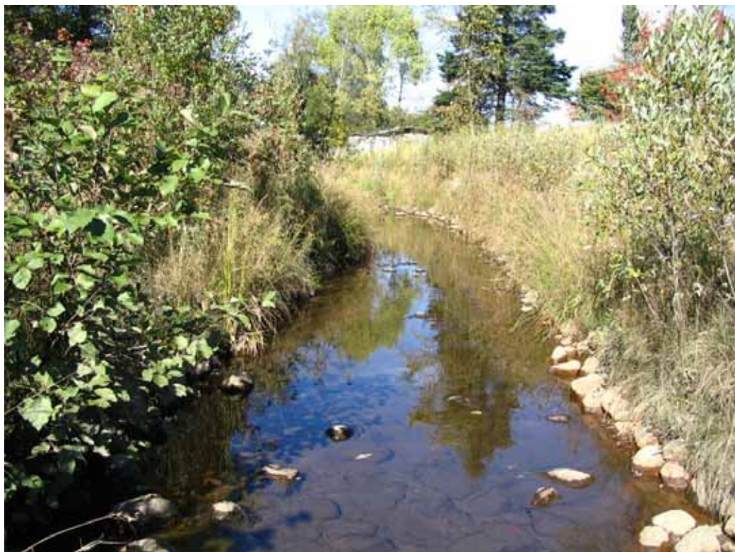
Septembre 2004 : Vue vers l'amont