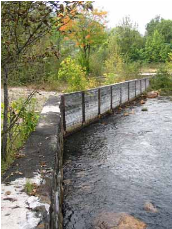
Septembre 2004 : Section centrale du mur