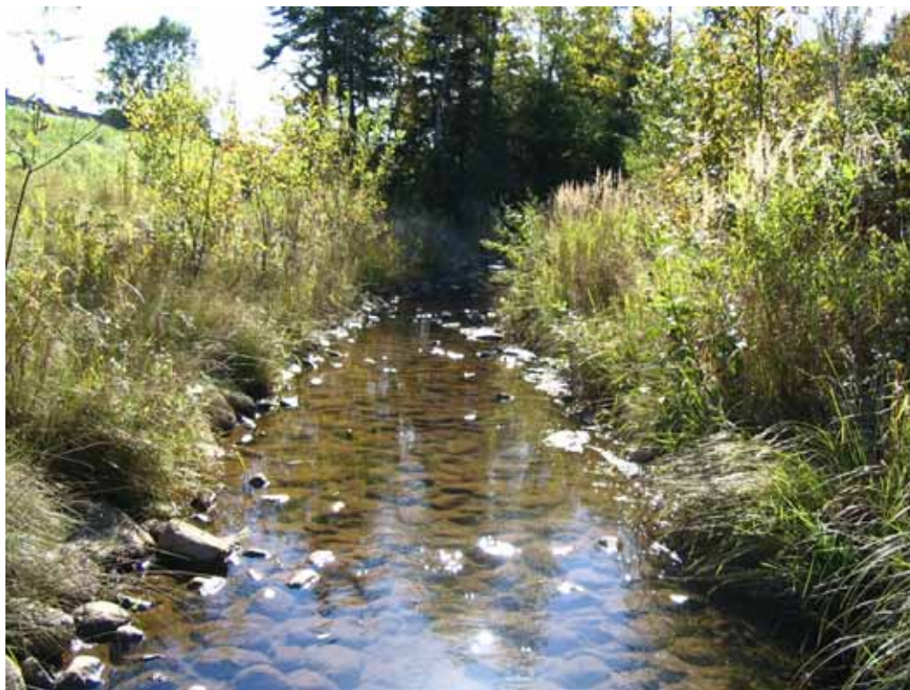
Septembre 2004 : Vue vers l'aval

Site #5 – Section très monotone d'un petit affluent longeant le chemin Crawford