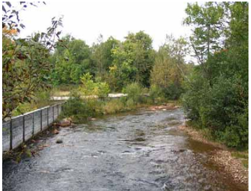
Septembre 2004 : Section amont du mur (caché partiellement par des arbustes)