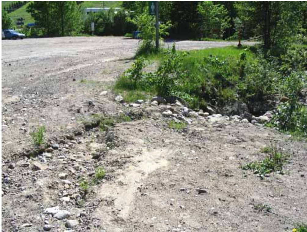
Juillet 2004 : Lessivage du sable et du gravier fin vers la rivière Hibou.