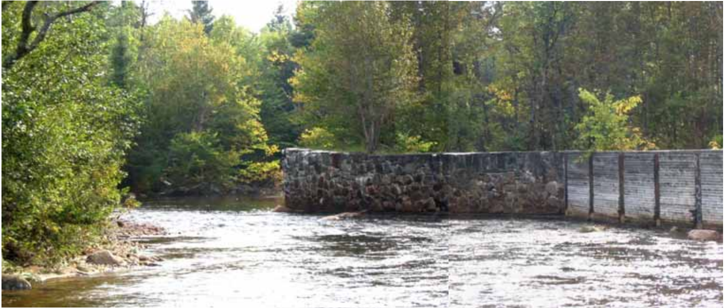
Septembre 2004 : Section aval du mur