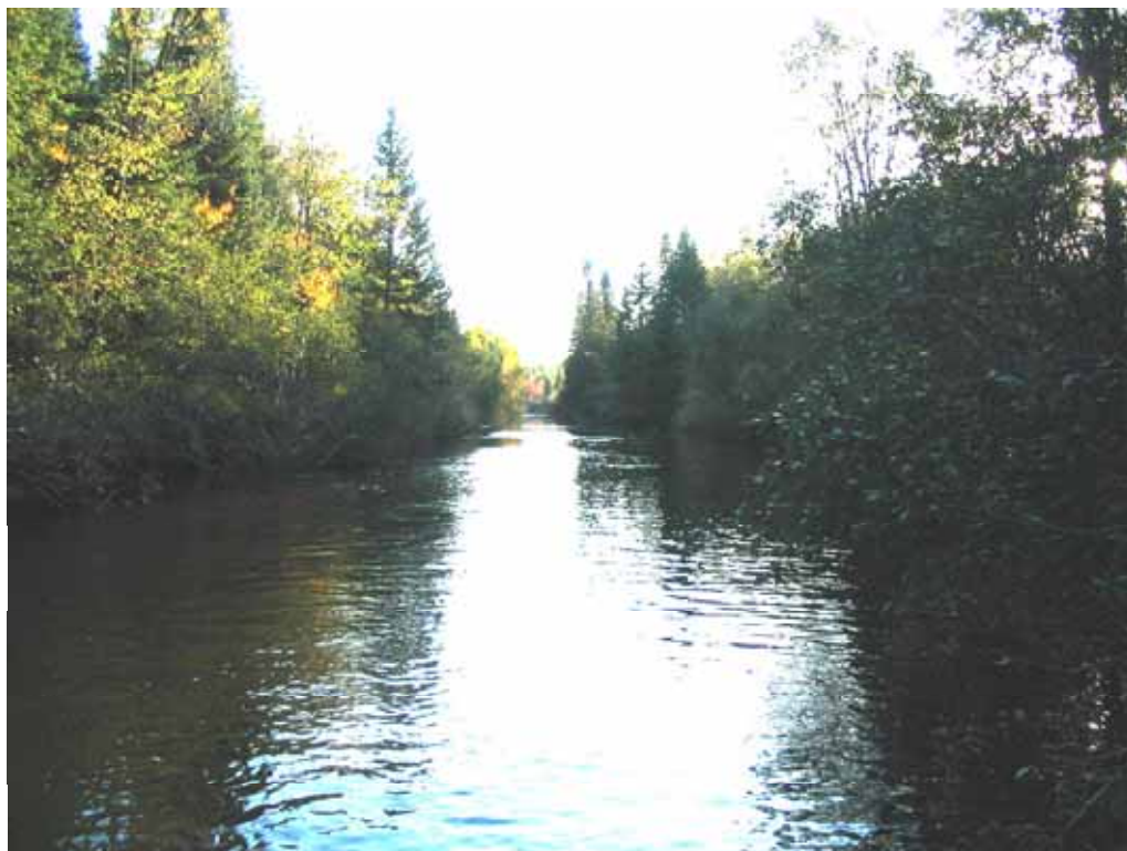
Septembre 2004 : Vue vers l'aval