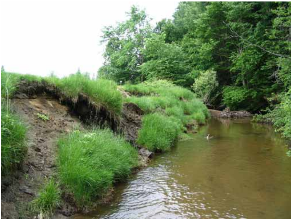
Juillet 2004 : Décrochage du talus herbacé