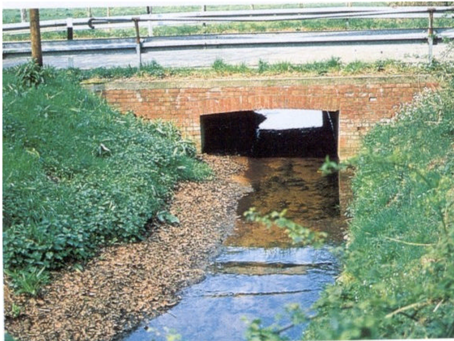
Réalisation d'un ponceau à deux niveaux.