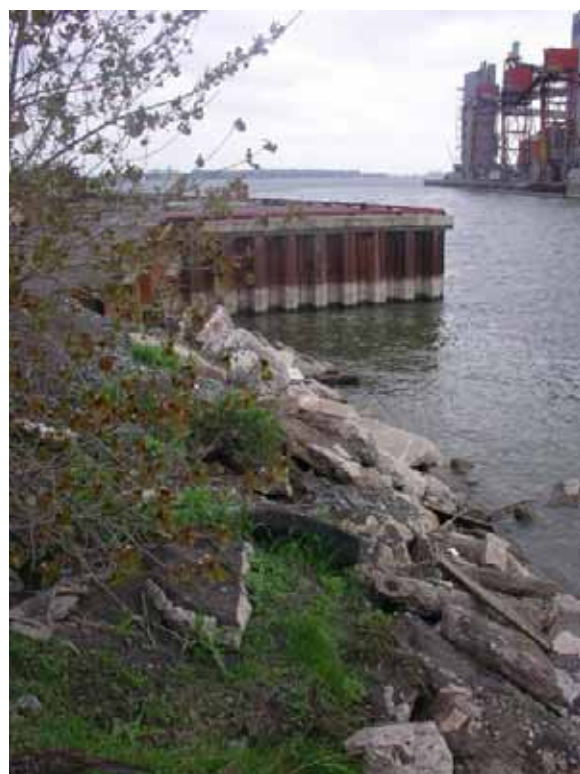
Photo 2.4 : Vue de l'extrémité sud (amont) du quai n°19 en bordure de la rivière Richelieu (2006)