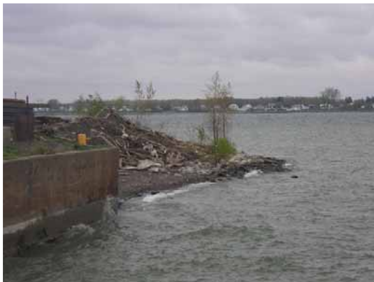
Photo 2.1 : État des rives de la rivière Richelieu en aval du quai n°19 à la confluence avec le fleuve Saint-Laurent (2006)