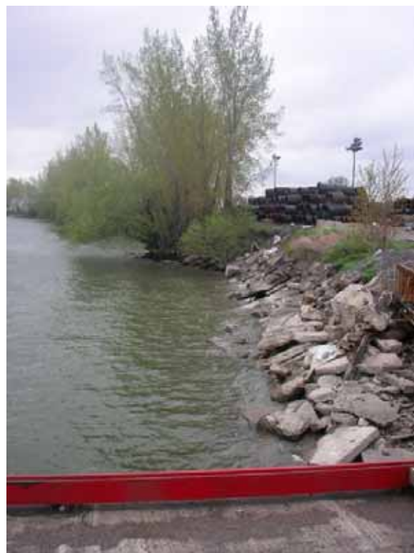
Photo 2.3 : État des rives de la rivière Richelieu en amont du quai n°19 (2006)