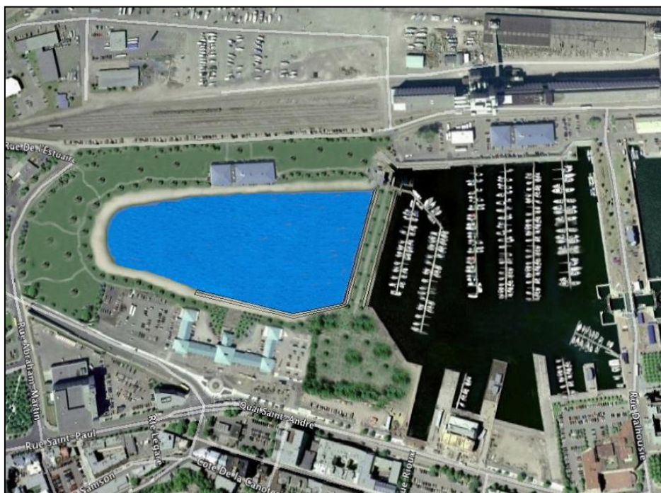
Figure 5 : Vue du parc-plage-marina proposé

Le concept de base de l'aménagement proposé consiste à scinder le bassin de la marina actuelle en aménageant à la tête du bassin un parc-plage accessible aux citoyens et aux touristes tout en retenant la fonction de la marina. Le tout maintient soigneusement la fonction de zone-tampon de cet endroit situé entre le portuaire et l'urbain et reprend le projet officiel du gouvernement fédéral en vue de Québec '84, concept que partageait à l'époque la Ville de Québec : voir ici .