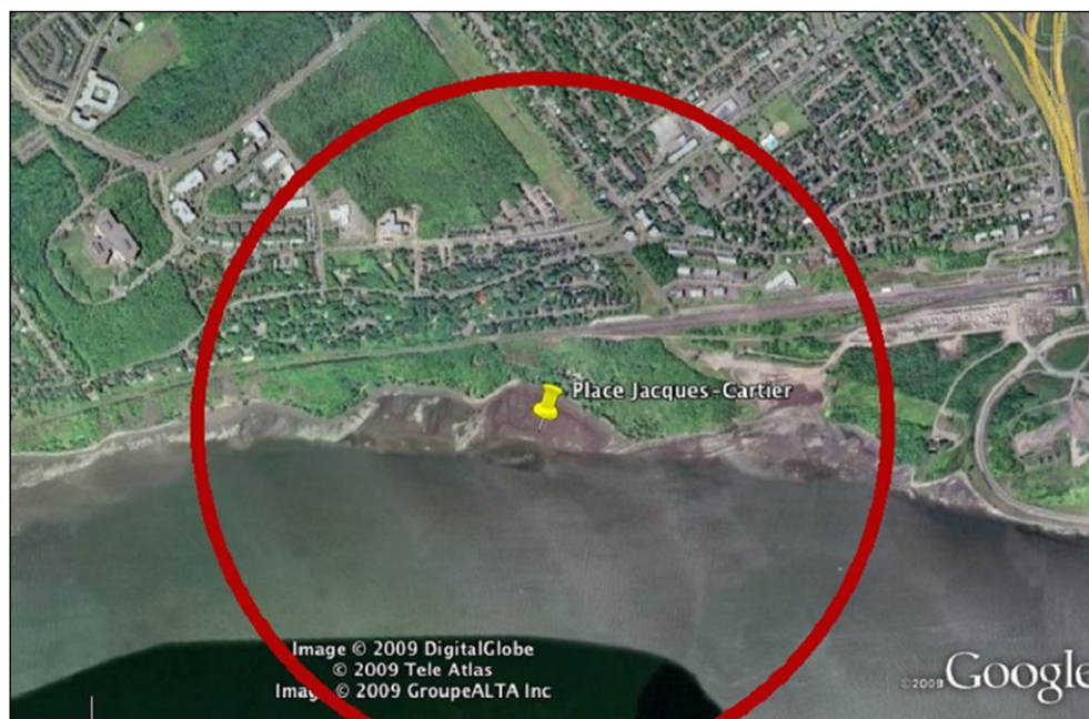
Figure 1: Parc de la plage Jacques-Cartier

le fleuve s'améliore d'année en année, celle-ci demeure variable selon les précipitations. Par ailleurs, le Plan vert, bleu, blanc mentionne à peine que la baignade pourrait y être éventuellement possible. Il s'agit surtout d'un site favorisant un contact privilégié avec le littoral.