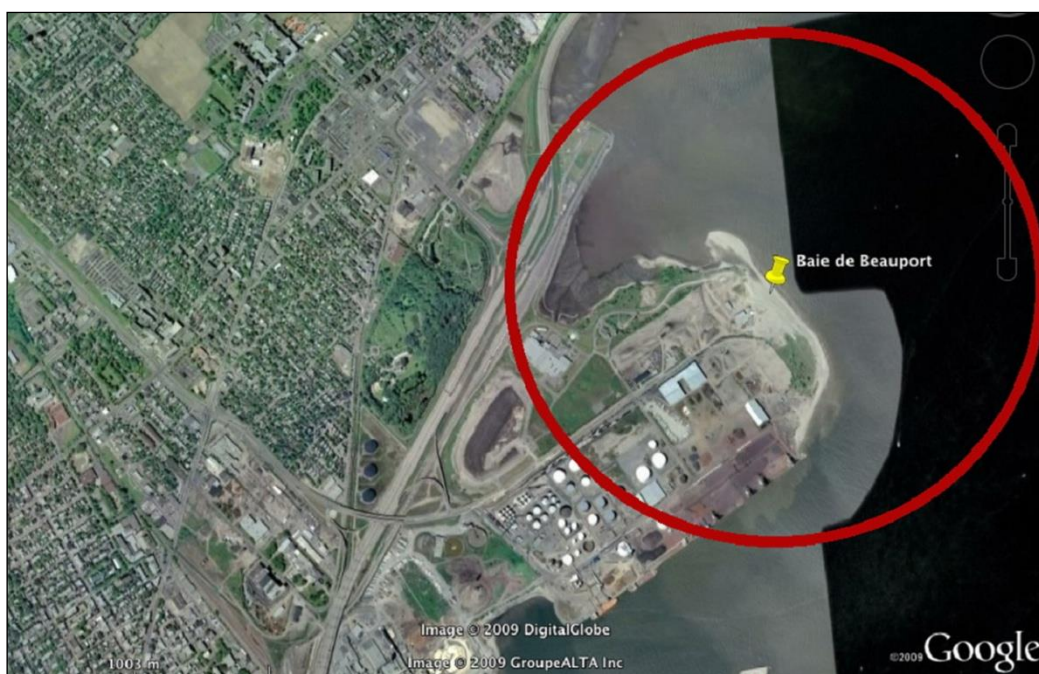
Figure 2 : Péninsule de Beauport

La plage de Beauport est par ailleurs menacée par de futures activités industrialo-portuaires envisagées par le Port de Québec, susceptibles de détériorer grandement le milieu actuel. L'Administration portuaire est résolue à y construire deux grands quais de transbordement de vracs, dont nul ne peut prédire s'ils provoqueront ou non un envasement de la plage actuelle.