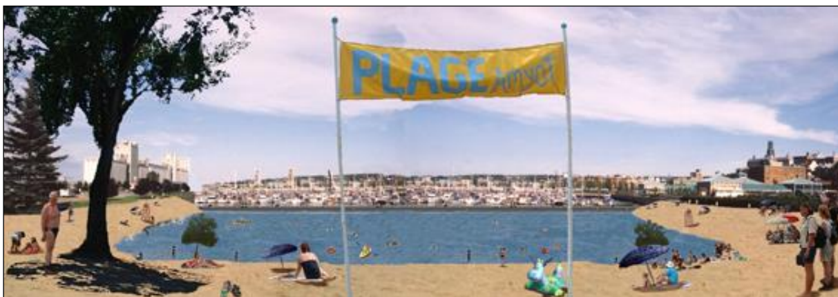
Figure 6 : Aspect général de la future plage au bassin Louise

Le bassin ouvert à de multiples activités publiques serait ni plus ni moins qu'une très grande piscine d'une surface d'environ 25 000 mètres carrés, soit la surface de 20 piscines olympiques. L'élévation du niveau de l'eau dans le bassin de tête contribuerait à maintenir une eau de qualité, renouvelée à partir du fleuve et filtrée selon les règles de l'art. Quant aux aspects sécuritaires, une plage en pente douce présente moins de dangers que les enrochements actuels qui n'inquiètent pourtant personne.