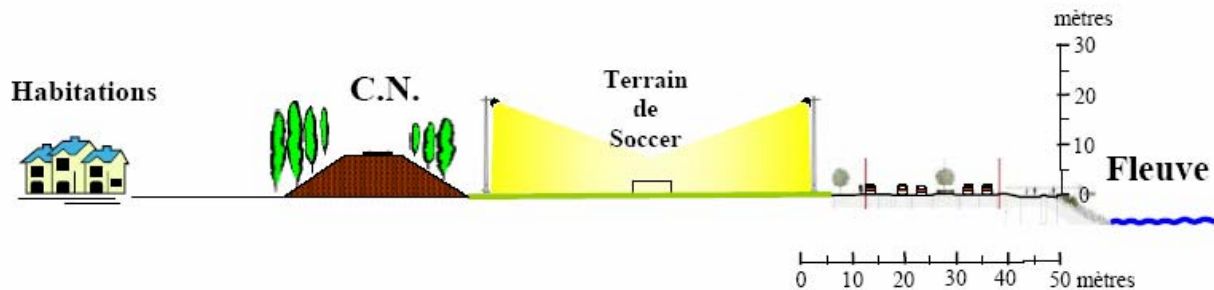
Schéma 2 : représentation schématique (coupe) d'un terrain de soccer éclairé.

Le schéma présenté ci-après (schéma 2) présente un dessin à l'échelle de la configuration physique qu'aurait un terrain de soccer éclairé à cet endroit. On constate à cet effet que l'éclairage n'indisposera que peu ou pas les habitations avoisinantes.