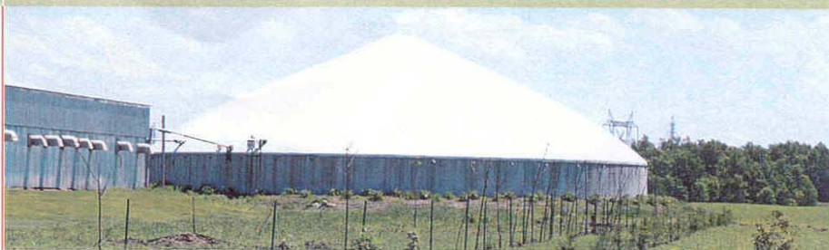
Une fosse à lisier recouverte d'une toiture de toile et une haie brise-odeur: deux mesures implantées aux Porcheries Chanca afin de réduire les odeurs.