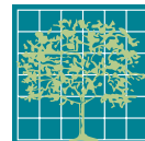
FIGURE 3-4 GROUPEMENTS VÉGÉTAUX

DDH Environnement Itée 505, boul. René-Lévesque Ouest 8e étage, Montréal (Québec)