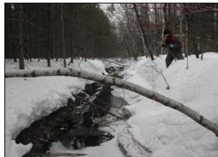
PHOTO AU SITE DE TRAVERSÉE

Topographie : Plane Utilisation du sol : Boisée Type de sol : Terrains marécageux (selon la carte pédologique)