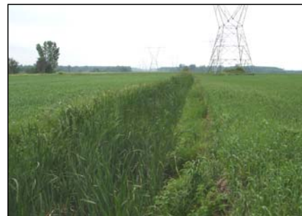
PHOTO AU SITE DE TRAVERSÉE

Topographie : Plane Utilisation du sol : Agricole Type de sol : Loam argileux calcaire Bedford (selon la carte pédologique)