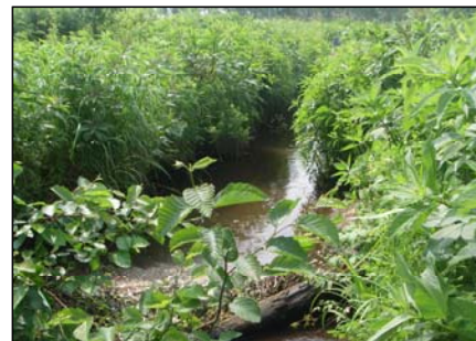
PHOTO AU SITE DE TRAVERSÉE

Topographie : Plane Utilisation du sol : Boisée Type de sol : S. I. à s. Saint-Jude + s. Saint-Samuel + I. s. à s. I. des Pins + s. I. Mawcook (selon la carte pédologique)