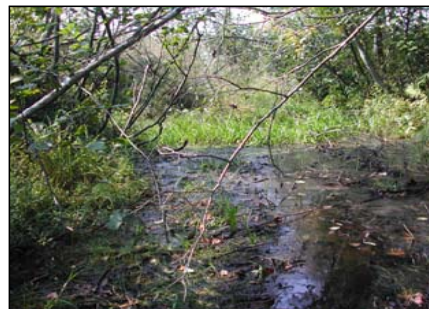
PHOTO AU SITE DE TRAVERSÉE

Topographie : Plane Utilisation du sol : Boisée Type de sol : Sable Sainte-Sophie + sable loameux à sable Saint-Jude + sable Saint-Samuel + terre noire (selon la carte pédologique)