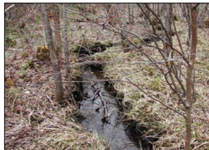
PHOTO AU SITE DE TRAVERSÉE

Topographie : Vallonnée Utilisation du sol : Boisée Type de sol : Loam sableux à loam des Pins + loam sableux Dosquet + loam sableux Fourchette + loam sableux Beurivage (selon la carte pédologique)