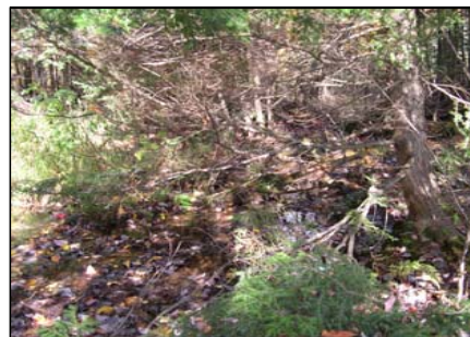
PHOTO AU SITE DE TRAVERSÉE

Topographie : Vallonnée Utilisation du sol : Boisée Type de sol : Sable fin à sable grossier Raimbault + sable loameux Saint-Sylvère + sable loameux à sable Saint-Jude (selon la carte pédologique)