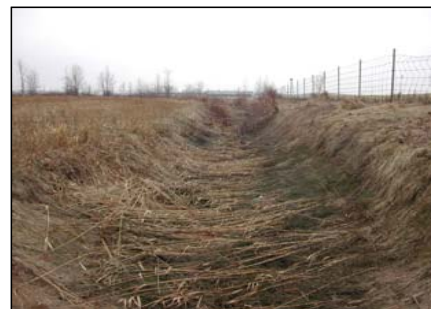
PHOTO AU SITE DE TRAVERSÉE

Topographie : Plane Utilisation du sol : Agricole Type de sol : Argile limoneuse mince sur roc Saint-Blaise (selon la carte pédologique)