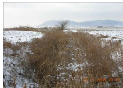
PHOTO AU SITE DE TRAVERSÉE

Topographie : Plane Utilisation du sol : Agricole Type de sol : Loam limono-argileux Saint-Hyacinthe (selon la carte pédologique)