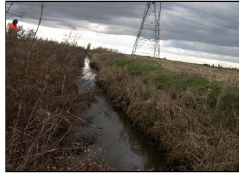
PHOTO AU SITE DE TRAVERSÉE

Topographie : Plane Utilisation du sol : Agricole Type de sol : Loam sablo-argileux calcaire Bedford (selon la carte pédologique)