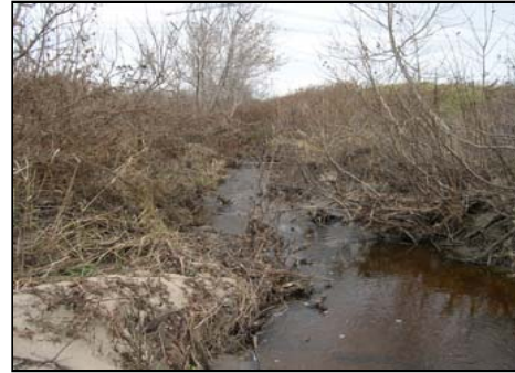
PHOTO AU SITE DE TRAVERSÉE

Topographie : Plane Utilisation du sol : Agricole Type de sol : Sable Saint-Amable (selon la carte pédologique)