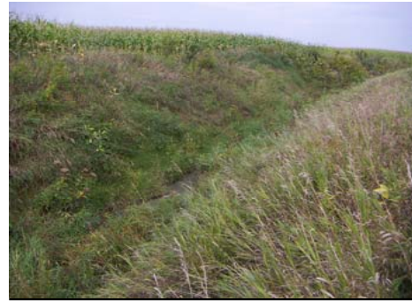
PHOTO AU SITE DE TRAVERSÉE

Topographie : Plane Utilisation du sol : Agricole Type de sol : Loam argileux Levrard (selon la carte pédologique)