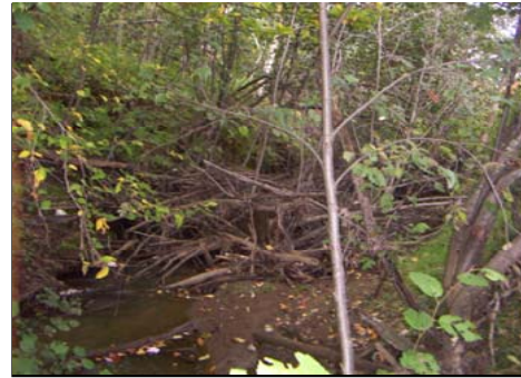
PHOTO AU SITE DE TRAVERSÉE

Topographie : Plane Utilisation du sol : Agricole Type de sol : Sable Saint-Jude (selon la carte pédologique)