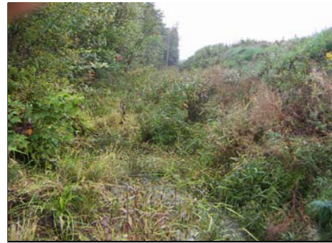
PHOTO AU SITE DE TRAVERSÉE

Topographie : Plane Utilisation du sol : Boisée Type de sol : Terre franche sableuse Saint-Jude (selon la carte pédologique)