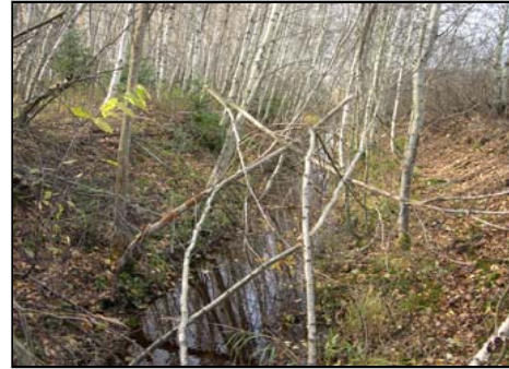
PHOTO AU SITE DE TRAVERSÉE

Topographie : Plane Utilisation du sol : Boisée Type de sol : Sable loam. à sab. grav. Dosquet + sab. loam. Mawcook + loam sab. à sab. loam. des Pins (selon la carte pédologique)