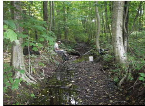
PHOTO AU SITE DE TRAVERSÉE

Topographie : Vallonnée Utilisation du sol : Boisée Type de sol : Tourbes + sable fin à sable grossier Raimbault (selon la carte pédologique)