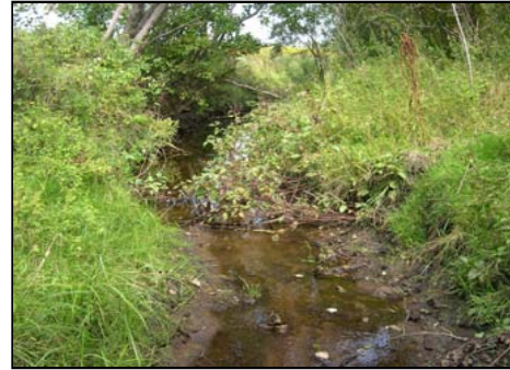
PHOTO AU SITE DE TRAVERSÉE

Topographie : Vallonnée Utilisation du sol : Boisée Type de sol : Loam sablo-pierreux des Pins + sable Saint-Amable (selon la carte pédologique)