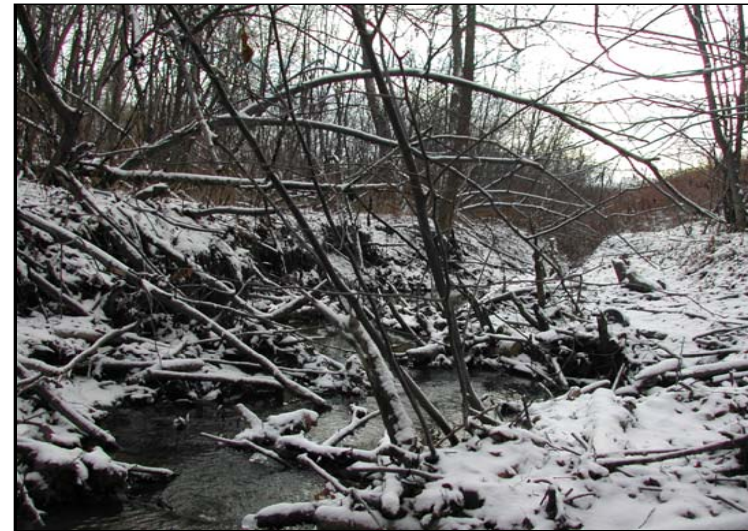
PHOTO AU SITE DE TRAVERSÉE

Topographie : Plane Utilisation du sol : Agricole Type de sol : Loam argileux + ravin escarpé et terrain alluvionnaire (selon la carte pédologique)