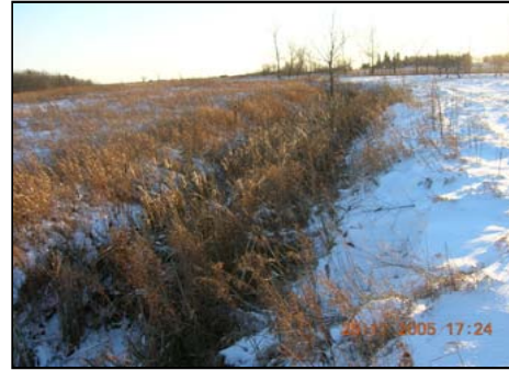
PHOTO AU SITE DE TRAVERSÉE

Topographie : Vallonnée Utilisation du sol : Agricole Type de sol : Ravin escarpé (selon la carte pédologique)