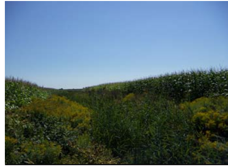
PHOTO AU SITE DE TRAVERSÉE

Topographie : Plane Utilisation du sol : Agricole Type de sol : Loam limono-argileux Sainte-Rosalie (selon la carte pédologique)