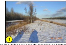
Rang des Aulnes au nord de l'emprise de l'autoroute 20