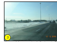
Lampadaire au centre de l'autoroute 20