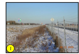
Rang des Aulnes au nord de l'emprise de l'autoroute 20