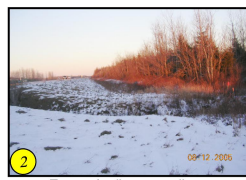
Traversée d'un cours d'eau