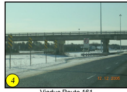
Viaduc Route 161