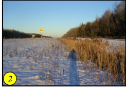
Rang des Aulnes au nord de l'emprise de l'autoroute 20