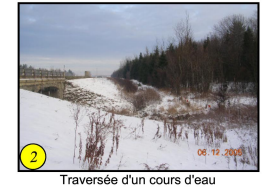
Talus moyen à abrupte