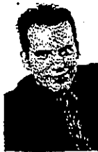
Sébastien Gagnon Député Lac-Saint-Jean - Saguenay