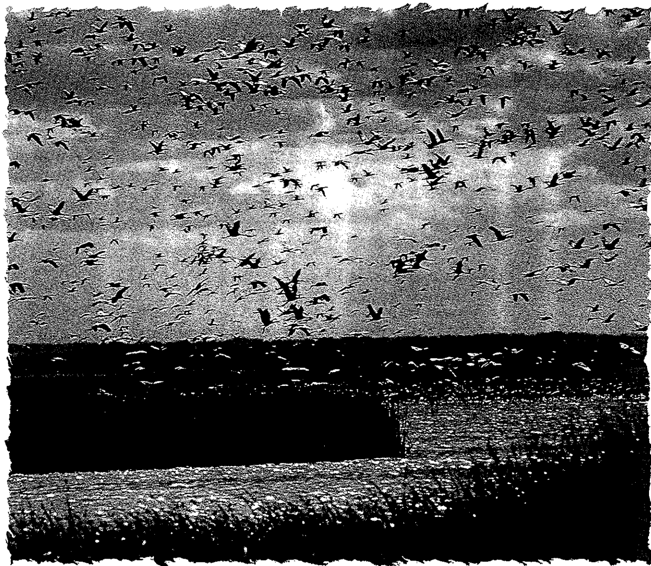
La sauvagine dans les marais des rives du lac Big Quill (Saskatchewan)

La Politique fédérale sur la conservation des terres humides complète les buts et objectifs du Plan nord-américain de gestion de la sauvagine, de la Politique fédérale relative aux eaux, la Politique de gestion de l'habitat du poisson de Pêches et Océans Canada, l'Accord sur la qualité de l'eau dans les Grands Lacs, la Convention internationale de Ramsar, l'initiative «Common Ground» d'Habitat faunique Canada et Une politique des espèces sauvages pour le Canada, adoptée par le Conseil canadien des ministres de la faune.