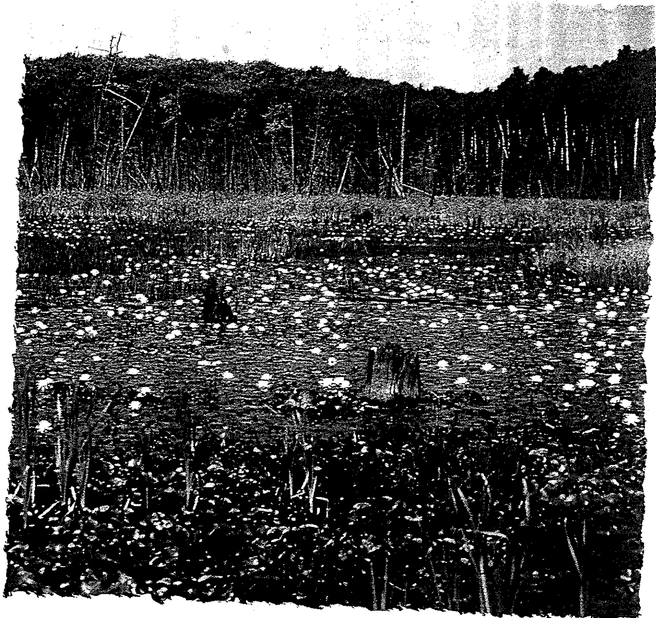
Un marécage à Walls Lake (Ontario)