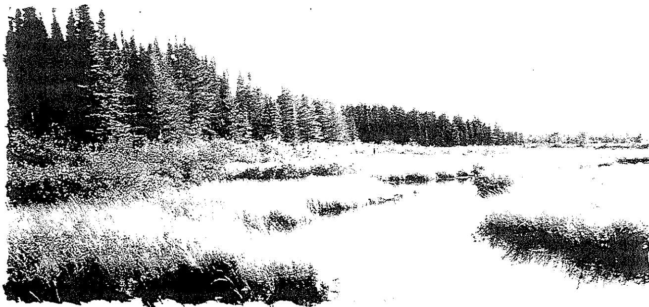
Un fen boréal en Ontario central

Canada, dont plusieurs touchent directement ou indirectement les terres humides. Par exemple, le gouvernement fédéral est lui-même un propriétaire foncier important, et il est directement responsable de la gestion de vastes terres humides situées dans différentes parties du pays. Plus de 29 % du total des terres humides du Canada se trouvent en territoire fédéral, principalement dans le nord canadien, au sein de parcs nationaux, de pâturages communautaires, de ports, de réserves de faune et d'un vaste éventail d'autres propriétés foncières de la Couronne. Les terres humides comptent pour environ 8 % de la superficie de nos parcs nationaux et 60 % de celle de nos réserves nationales de faune et refuges d'oiseaux migrateurs. De plus, le gouvernement fédéral élabore et met en oeuvre un éventail de politiques et programmes sociaux, économiques et environnementaux, à l'échelle tant internationale que nationale, qui peuvent avoir des répercussions sur la conservation et l'utilisation des terres humides, et il assume des obligations en vertu de traités internationaux à l'égard des terres humides.