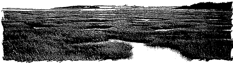
Les marais côtiers de la baie de Fundy (Nouveau-Brunswick)