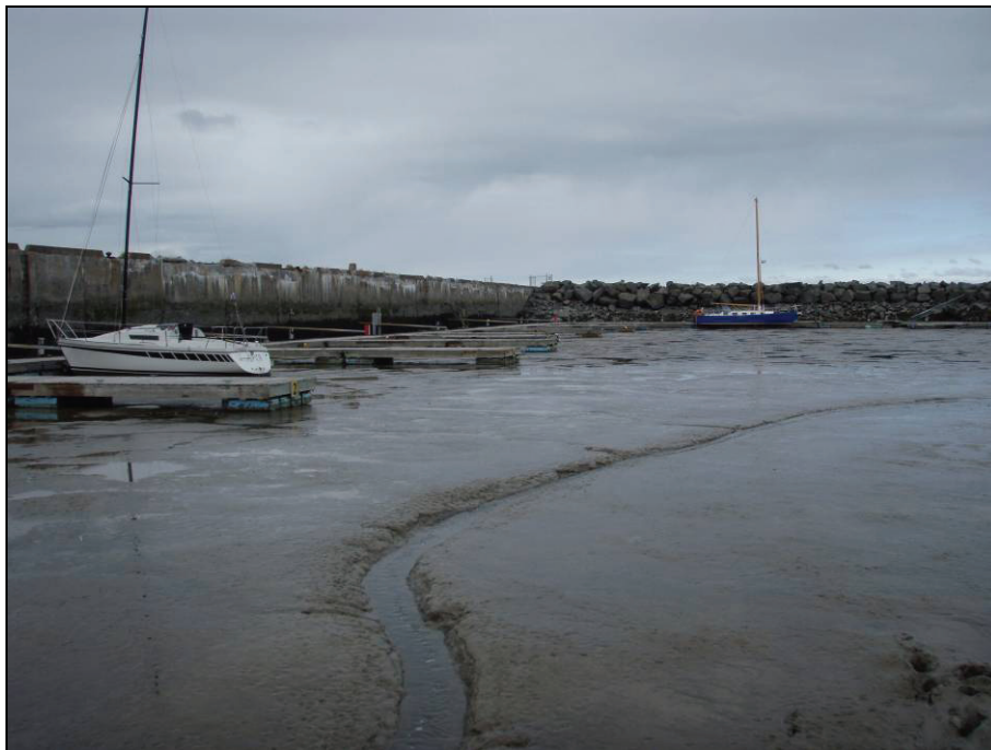
Photographie # 2

Marina de Rivière du Loup, marée basse, vue vers le nord, 29 avril 2010