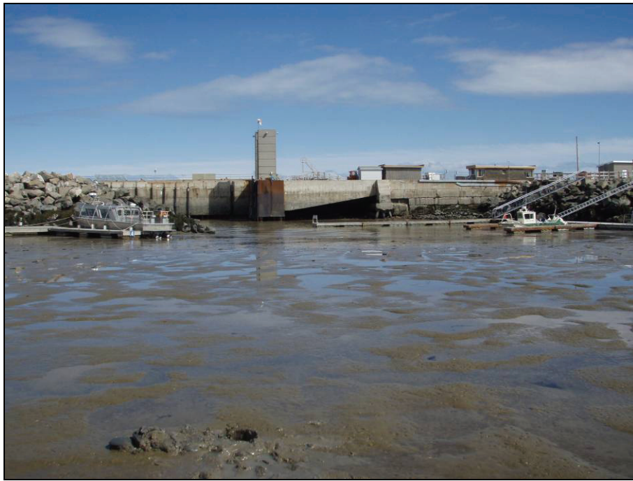
Photographie # 1

Marina de Rivière du Loup, marée basse, vue vers le nord, 29 avril 2010