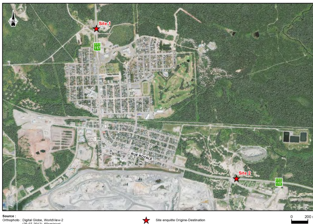
Figure 1-1 Localisation des sites d'enquête OD

L'enquête OD a été réalisée pour les véhicules qui sortaient de la ville de Malartic. Le choix d'enquêter sur une seule direction permet d'obtenir un maximum d'informations, d'intercepter toutes les clientèles visées et d'optimiser la gestion de l'enquête sur le terrain (nombre de releveurs/enquêteurs nécessaires, conditions de circulation et de sécurité) et le traitement des résultats. Cependant, le fait d'intercepter les clientèles sur une seule direction ne permet pas de capturer les clientèles qui pénètrent dans la ville, mais repartent après 22 h le jour de l'enquête.