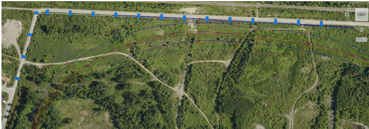
Secteur de la déviation d'Ouest en Est

Secteur Chemin des étangs et Avenue Champlain (agrandi)