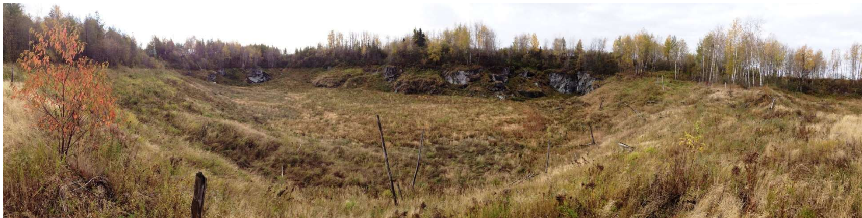
Effondrement Barnat (actuel)