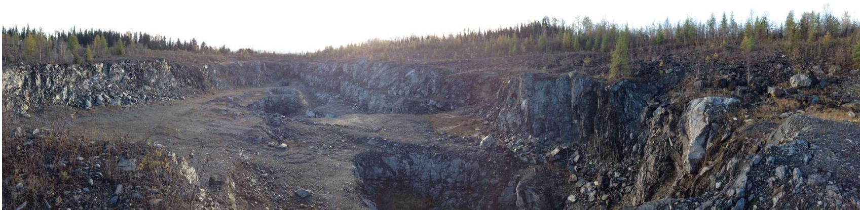
Fosse Buckshot (actuel)