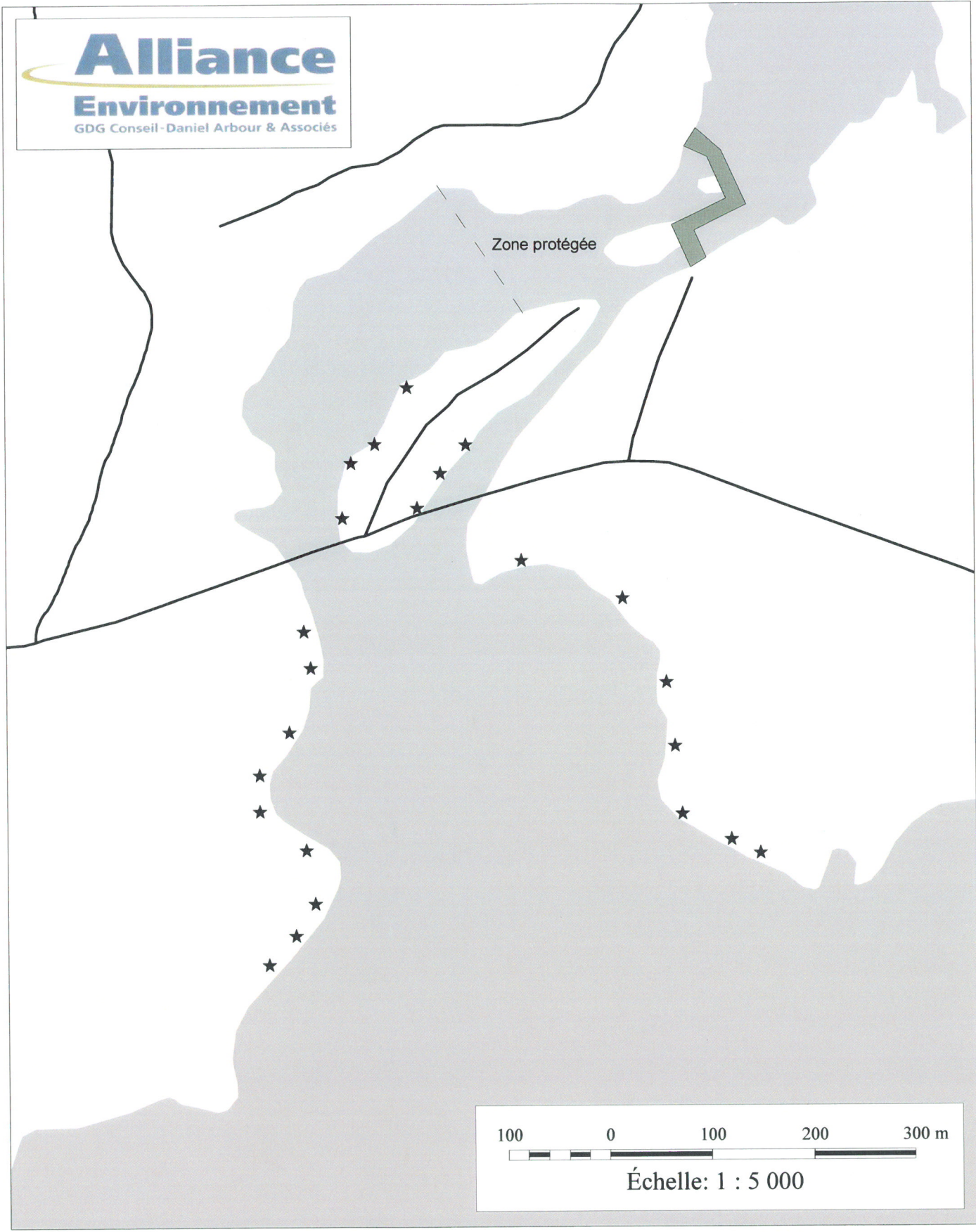
Figure RQC-9.1 : Emplacement des sites de pêche sportive en aval de la première chute. RSW inc.