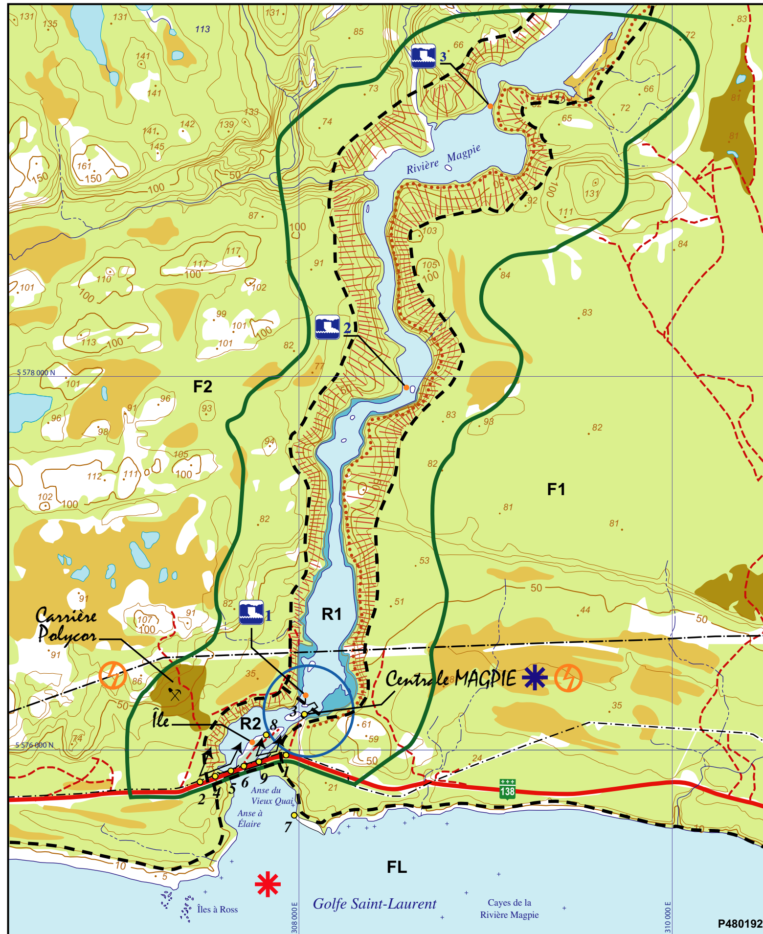
Figure 23.1 ÉLÉMENTS DU PAYSAGE