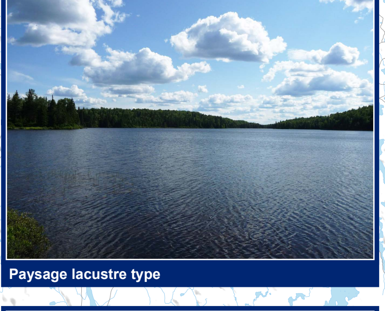
Paysage lacustre type