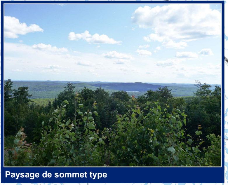
Paysage de sommet type