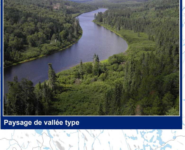
Paysage de vallée type