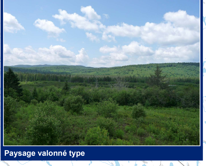
Paysage vallonné type