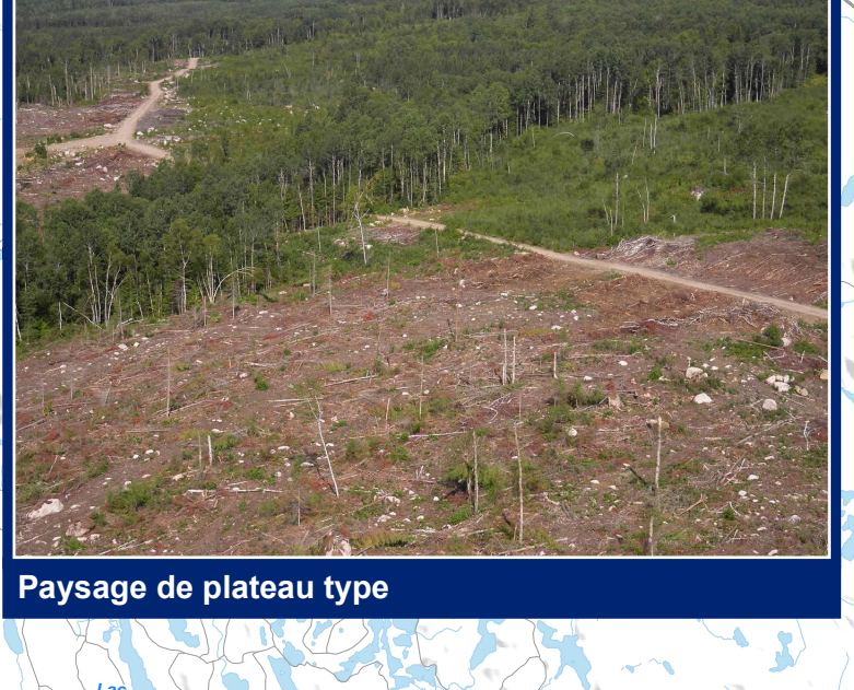
Paysage de plateau type