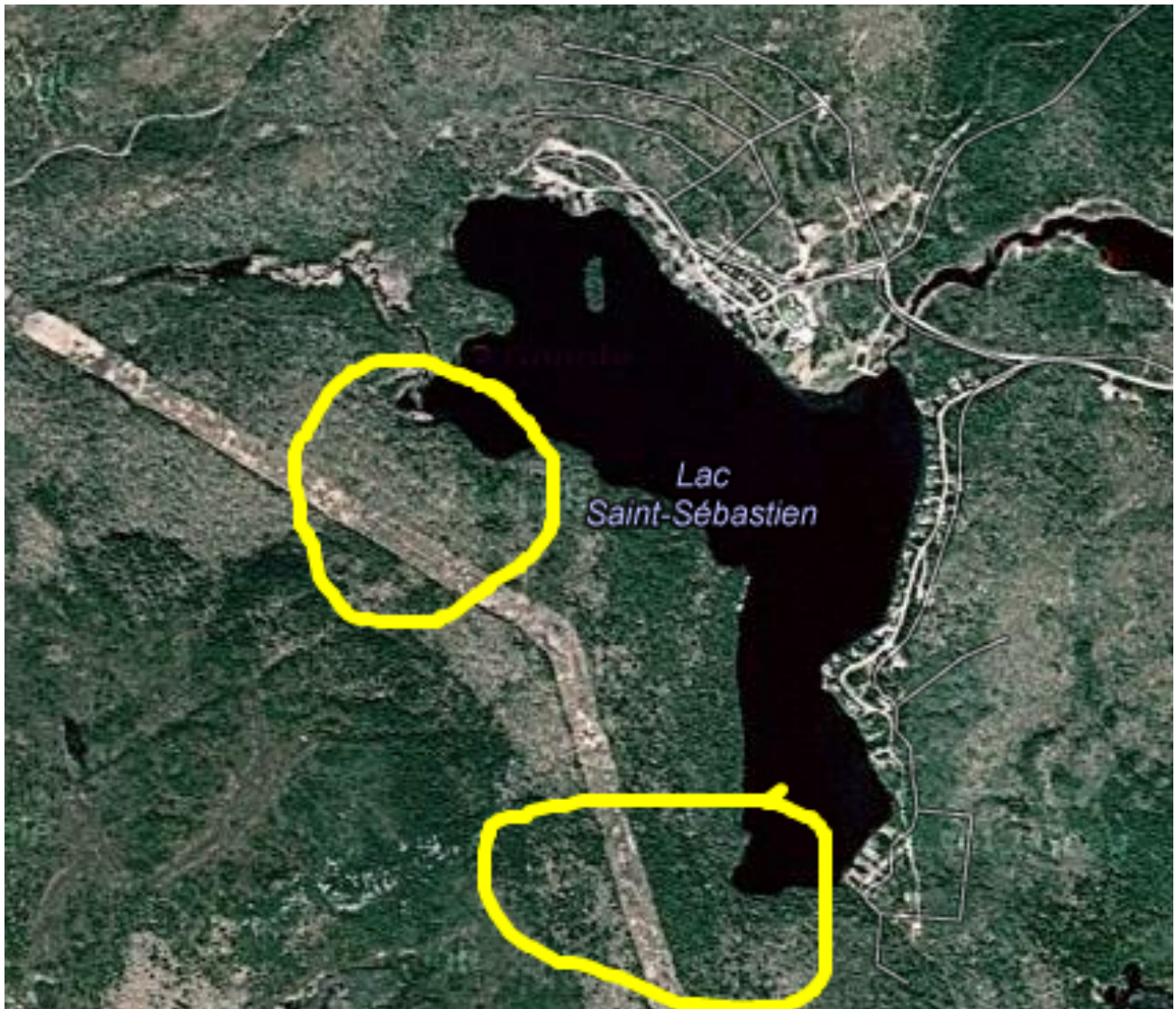
FIGURE 1 : Proximité de la ligne actuelle du lac