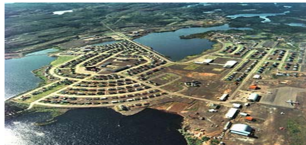
Ville de Schefferville