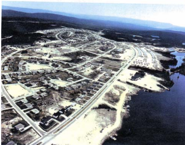
Ville de Gagnon maintenant fermée et démolie

Les villes de la MRC de Caniapiscau furent créées suite à l'exploitation des différents gisements miniers. Parmi celles-ci, la Ville de Gagnon fut abolie par les variations de l'industrie minière. C'est pourquoi, le projet du lac Bloom a une importance capitale pour notre région.