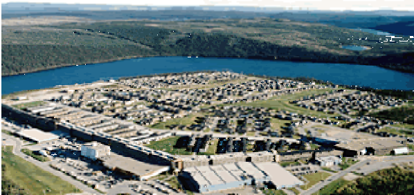
Ville de Fermont