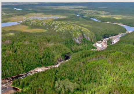
CENTRALE HYDROÉLECTRIQUE COURBE DU SAULT, en partenariat avec la MRC de Minganie