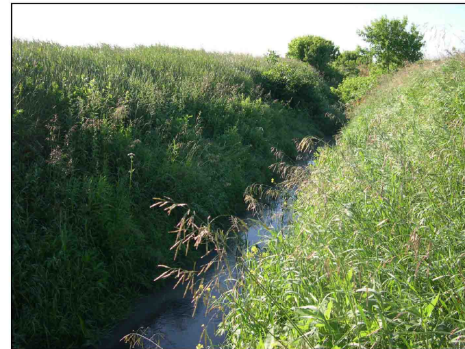
PHOTO AU SITE DE TRAVERSÉE

Topographie: plane Utilisation du sol: cultivé Type de sol (selon carte pédologique): Argile Ste-Rosalie