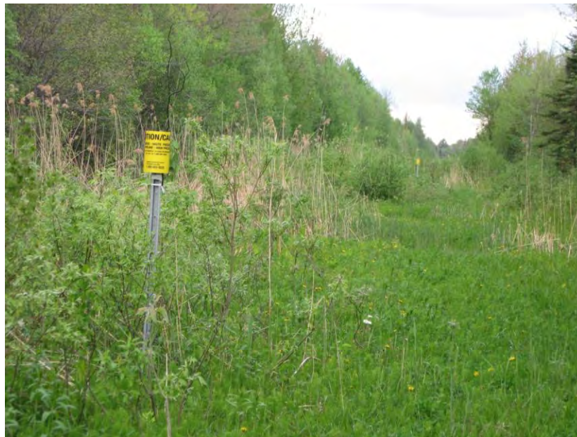
Figure 2 : Corridor du gazoduc de Gaz Métro reliant le réseau de distribution aux cavernes de Saint-Flavien. Ce corridor situé en milieu forestier est actuellement envahi par le phragmite commun. Saint-Apollinaire, mai 2014.

Les gazoducs qui traverseront les milieux boisés auront un impact particulièrement important, car ces corridors doivent en tout temps être libres d'arbres et d'arbustes créant une barrière pour nombre d'espèces forestières et deviendront une voie de pénétration des espèces généralistes et des EEE. La figure 2 illustre le corridor du gazoduc construit pour relier les cavernes de Saint-Flavien au réseau de Gaz Métro permettant d'entreposer des réserves de gaz en période de faible demande. Ce corridor est entièrement envahi par le phragmite commun malgré que ce secteur soit en milieu forestier à la limite de lots, loin des routes. Cette plante via les canaux de drainage se propagera et éventuellement rejoindra des milieux humides qui souffriront d'une forte baisse de biodiversité végétale avec des conséquences sur leur valeur écologique. D'autres plantes pourraient profiter de cette percée dans le milieu forestier et envahir le territoire. Cela pourrait être d'autant plus nuisible du fait que plusieurs de ces espèces sont presque impossibles à contrôler.