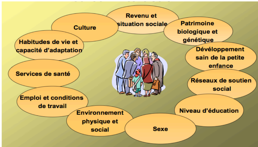
Figure 1 Déterminants de la santé